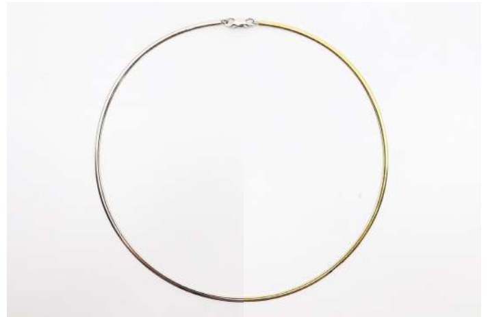
69| Collier en or jaune et gris 18K. Poids : 12,4 g