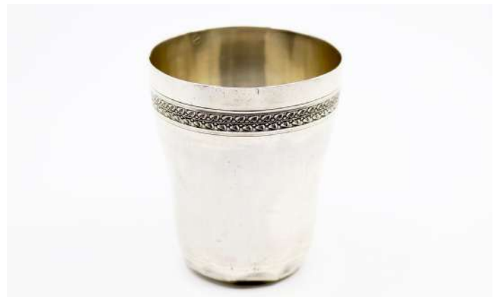
193| Tymbale en argent légèrement fuselée, à décor d'une frise feuillagée.