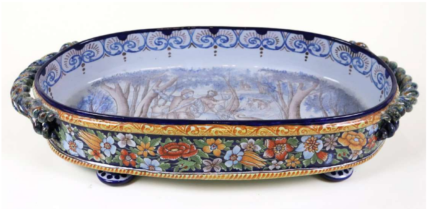
262| Antoine MONTAGNON à NEVERS Importante jardinière de table en faïence émaillée à décor polychrome de scène de chasse au centre du bassin et guirlandes de fleurs en ceinture. Les prises à décor torsé. De style Renaissance. Haut. : 13 cm - Long. : 65 cm