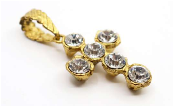
12,01| Christian LACROIX Pendentif croix en métal doré et strass. Signé. Long. : 5,8 cm