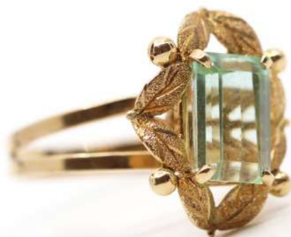
105| Bague fleur en or jaune ornée d'une pierre de couleur turquoise. Poids : 4,4 g