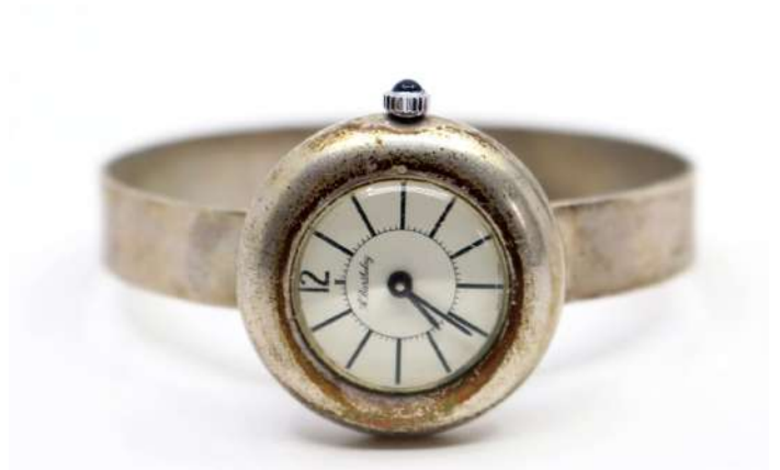
15| A. BERTHELAY Montre bracelet de dame en argent 800. Le boîtier rond à cadran émaillé blanc et index bâtons. Signée. Poids brut : 31,4 g