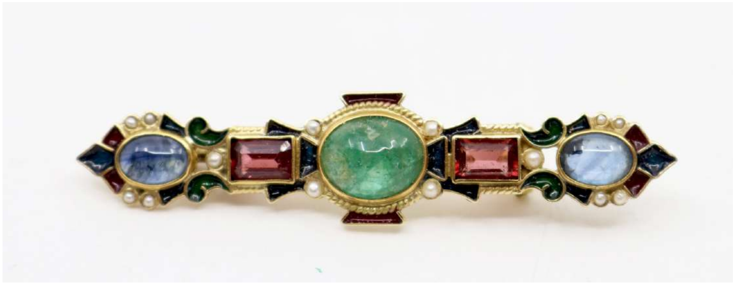
140| PERCOSSI PAPI Broche en or jaune et émail de style Renaissance sertie de pierres fines. Signée. Poids brut : 6,4 g