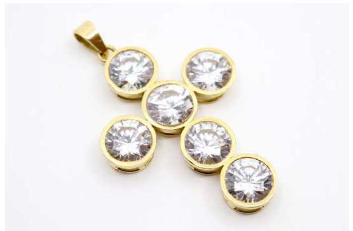
59,01| Pendentif croix en or jaune serti de 6 cristaux blancs. Poids brut : 32,2 g