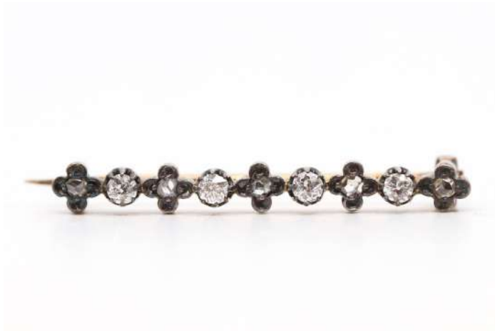
126| Broche barrette en or jaune à décor en alternance de trèfle centré d'une petite rose et d'un petit brillant. Poids : 2,9 g