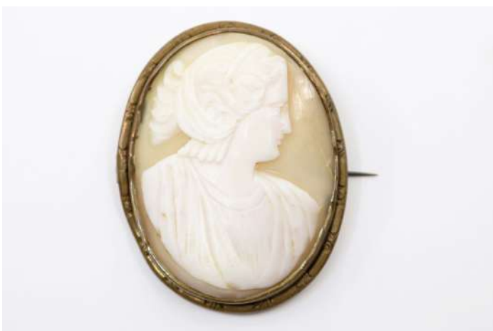
31| Camée sur coquille à décor d'un profil à l'antique dans un entourage en laiton. Début du XXe siècle. (Fêle).