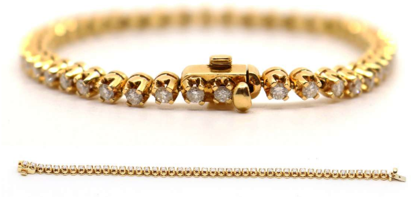
78,01| Bracelet rivière en or jaune serti de 45 diamants taille brillant. Poids brut : 17,3 g - Long. : 18 cm