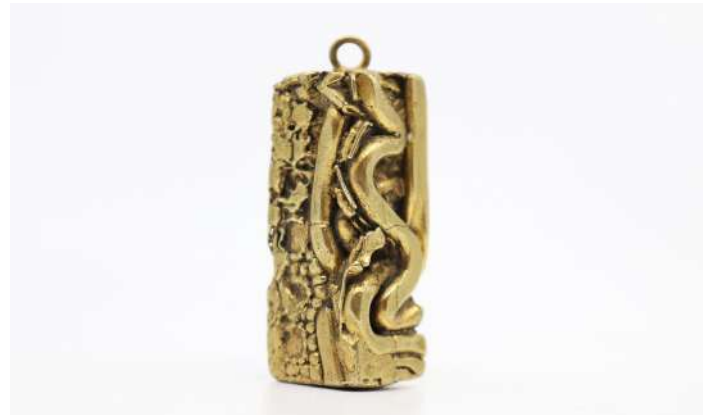
142| CÉSAR BALDACCINI dit CESAR (1921-1998) [Dans le goût de] Compression en bronze doré montée en pendentif. Haut. : 3,9 cm - Larg. : 1,5 cm - Prof. : 1,5 cm