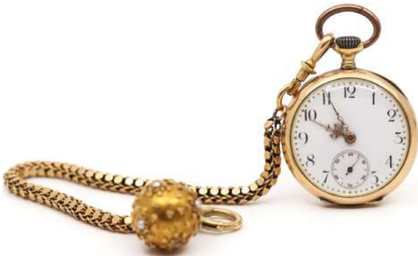
116| Montre à gousset en or jaune chiffrée BC. Cadran émaillé blanc à chiffres arabes. Cuvette intérieure en or. Avec une chaîne de montre à attache en forme de boule ornée de petites perles. Poids : 30,4 g