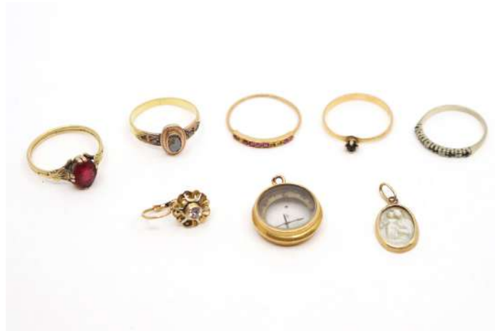
127| Ensemble de petits bijoux en or dont bagues, médaille, pendentif. Poids : 12,2 g