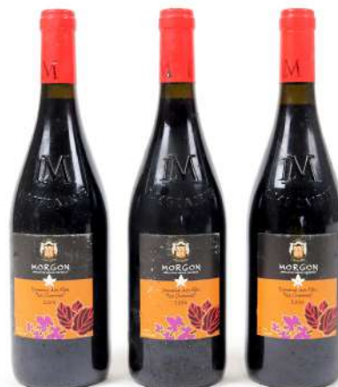
281| Ensemble de 3 bouteilles MORGON Domaine des Fûts "Les Charmes" 2006. (2 bouteilles TLB et 1 bouteille LB).