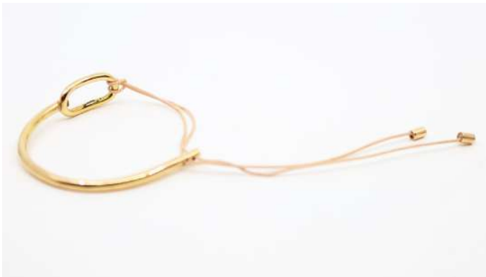
92| Marc DELOCHE Bracelet demi-jonc en or jaune et lien élastique. Signé. Poids : 11,9 g