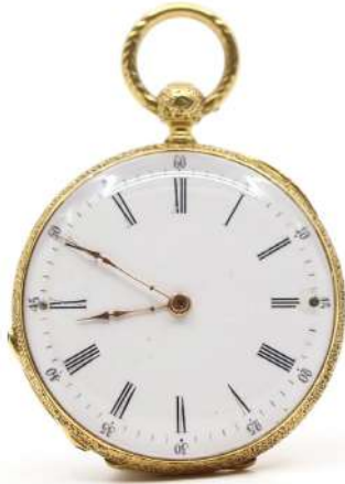
114| Petite montre à gousset en or jaune guilloché, à décor d'une fleurette partiellement émaillé noir. Cadran émaillé blanc à chiffres romains. Cuvette intérieure en or. Poids : 23,8 g