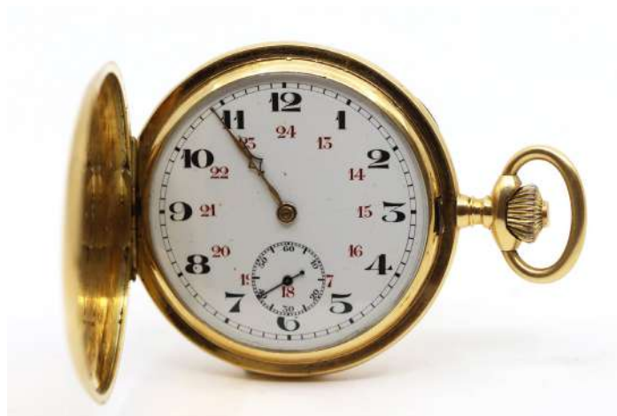
119| Montre à gousset en or jaune à double boîtier. Cadran émaillé blanc à chiffres arabes. Cuvette intérieure en or jaune.