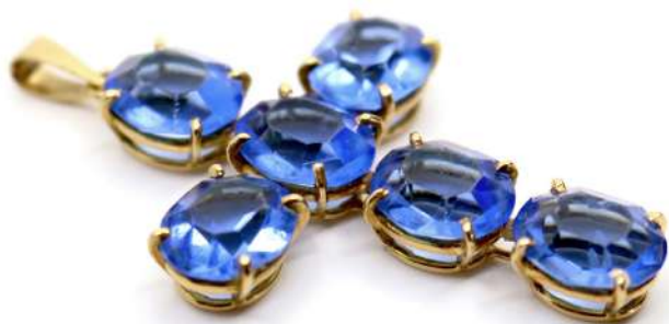
59,02| Pendentif croix en or jaune serti de 6 cristaux synthétiques bleus. Poids brut : 11,7 g