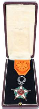
161| Ordre marocain du ouissam alaouite en boîte avec ruban orange uni et bouffette avant 1934. (Léger manque à l'émail rouge à l'avert). Fabrication Arthus Bertrand Paris.