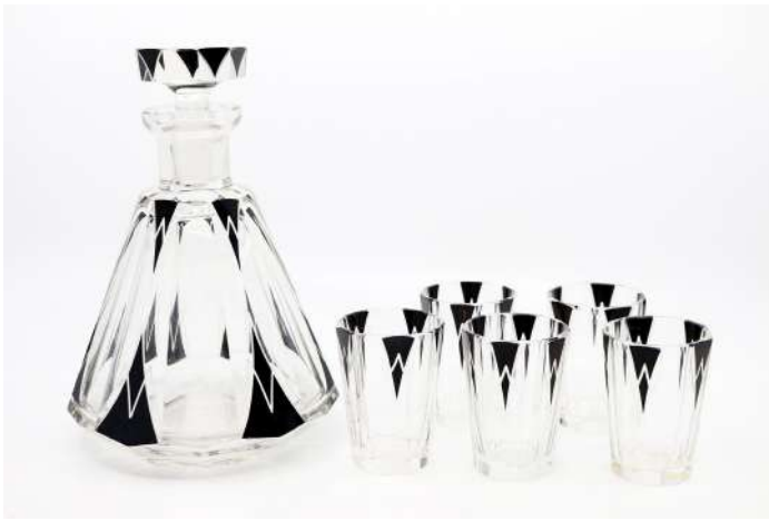
244| Carafe en verre et ses cinq petits verres à liqueur de style art déco. (Accident). Haut. : 20 cm (carafe) - 7 cm (verres)