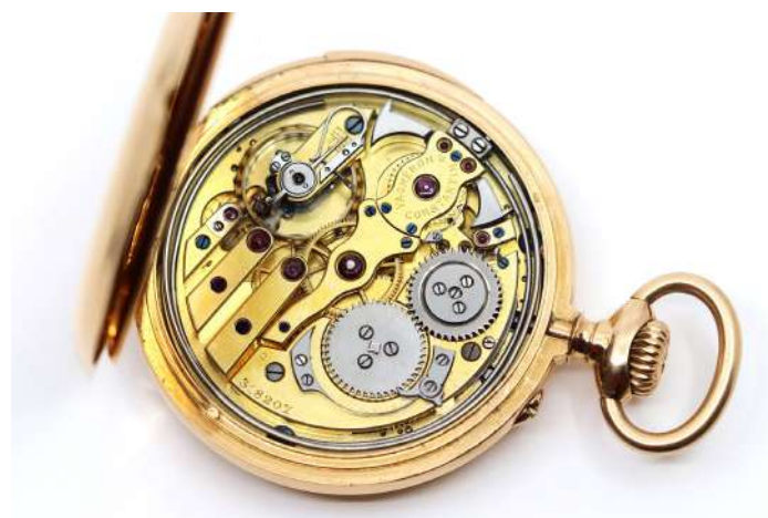
107| Importante montre à gousset en or jaune chiffrée CL. Cadran émaillé blanc à chiffres arabes signé Vacheron & Constantin à Genève. Cuvette intérieure en or jaune. Dans son écrin d'origine. Poids : 103,9 g