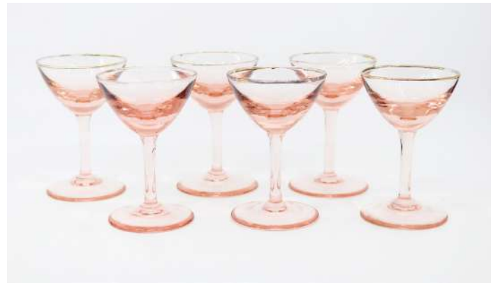
250| Partie de service à liqueur comprenant 5 petits verres sur piédouche en verre rose orné d'un filet doré.