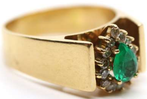
45| Bague en or jaune ornée d'une petite marguerite avec une émeraude taillée en poire et ceinte de petits diamants. (Manque une petite rose). Poids : 7,1 g