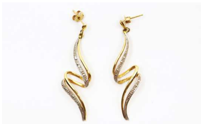
66| Paire de boucles d'oreilles en or jaune et gris.