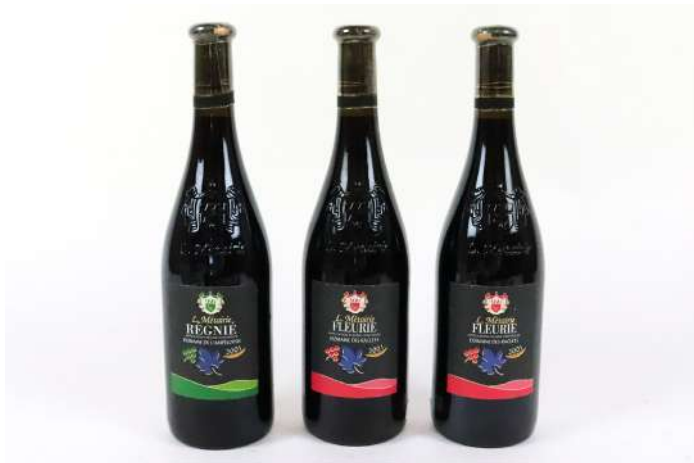
266| Ensemble de trois bouteilles BEAUJOLAIS dont 1 btle Régnié, Domaine de L'Ampélopsis, 2001 et 2 btles Fleurie, Domaine des Raclets, 2001. 20/30€