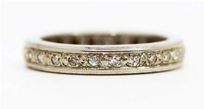
115| Alliance américaine en or gris sertie de petits diamants. TDD : 48 Poids brut : 4 g