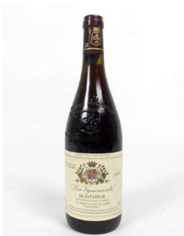
263| 1 bouteille Les Vignemonts, Monthélie 2006 (TLB).