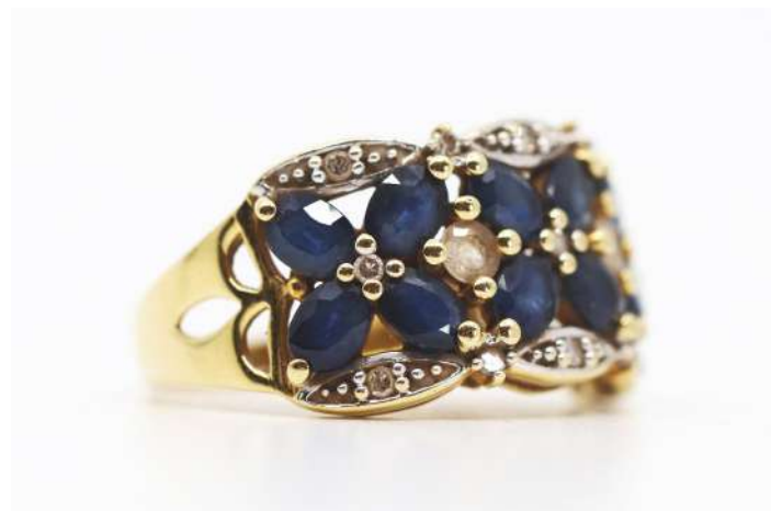
71| Bague en or jaune sertie de saphirs et brillants. Poids brut : 5 g