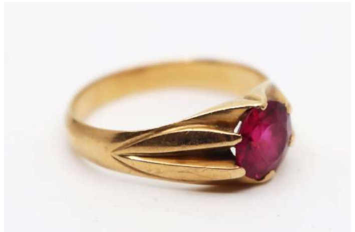
97| Petite bague en or jaune ornée d'un rubis. Poids : 4,6 g