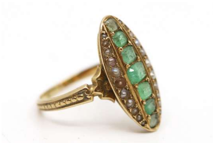
129| Bague navette en or jaune ornée d'une rangée de petites émeraudes de taille décroissante et de part et d'autre de petites perles. Poids : 4,4 g