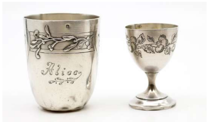
168| Lot en argent comprenant : - un coquetier sur piedouche à décor d'une branche fruitée. Poinçon Minerve - une timbale à fond plat à frise de gui de style art nouveau. Marqué "Alice". Poinçon Minerve. (Enfoncements). Poids : 129,5 g