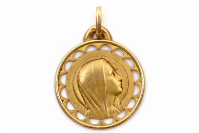
63| Médaille en or jaune représentant la Vierge sur une face et l'apparition de la Vierge à Bernadette Soubirous à Lourdes sur l'autre face. Poids : 2,1 g