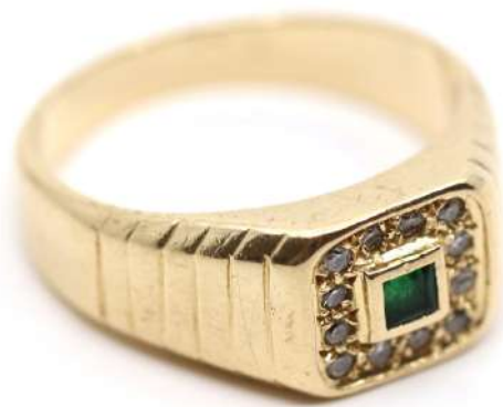
51| Bague chevalière en or jaune ornée au centre d'une petite émeraude taillée en carré et ceinte de petites roses.