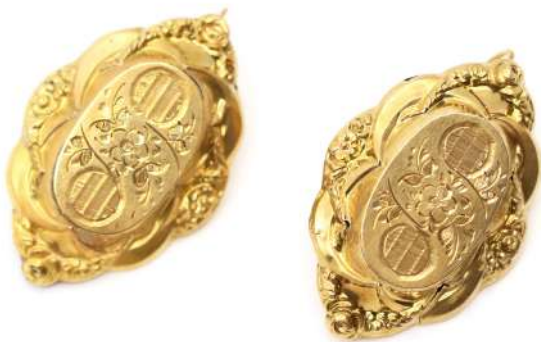
52| Paire de boucle d'oreilles en or jaune à décor de guirlandes fleuries.