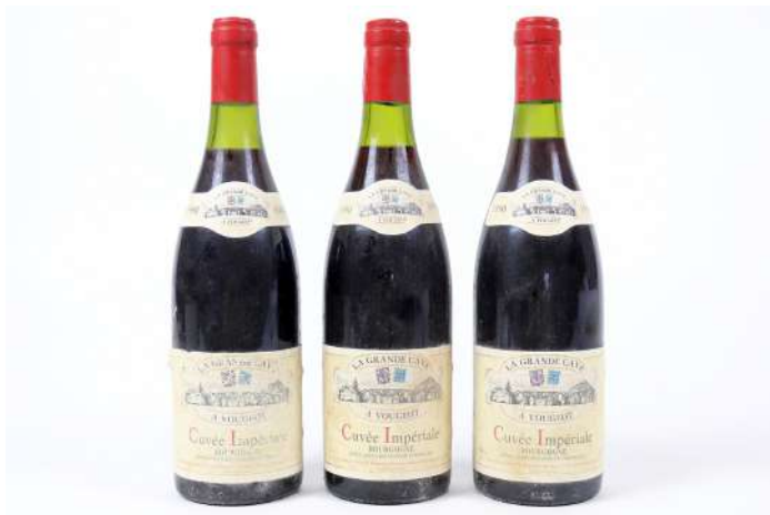
274| Ensemble de 3 bouteilles BOURGOGNE Cuvée Impériale 1990. La Grande cave à Vougeot Négociant. (LB).