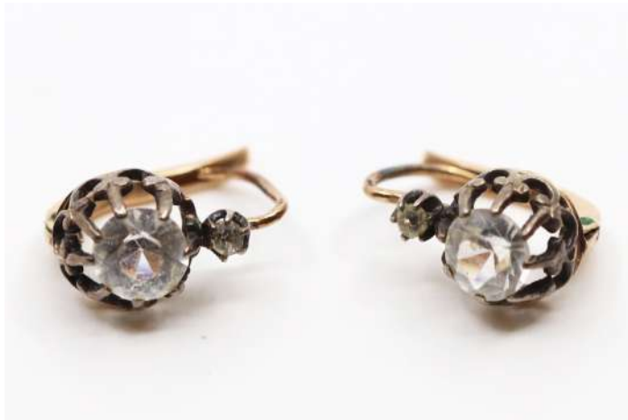
77| Paire de boucles d'oreilles en or jaune, ornée d'une pierre blanche. Poids : 2,4 g