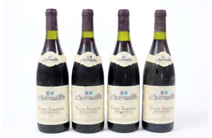
275| Ensemble de 4 bouteilles BOURGOGNE Cuvée Impériale 1996. La Grande cave à Vougeot Négociant. (LB).