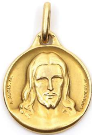
81| Médaille de baptême en or jaune à décor du visage du Christ.