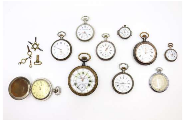
24| Ensemble de dix montres de gousset en métal ou argent, dont une LIP.