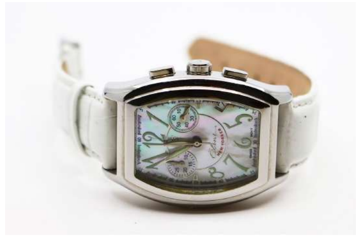
22| ELINI Montre chronographe de dame en acier, modèle NEW YORKER, le boîtier de forme tonneau, cadran en nacre à chiffres arabes et le bracelet en cuir blanc façon croco.