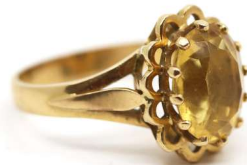
128| Bague de type marguerite en or jaune ornée d'une importante citrine de taille ovale. Poids : 6,3 g