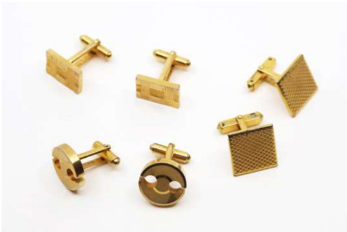
29| Ensemble de trois paires de boutons de manchettes en métal plaqué or à motifs guillochés.