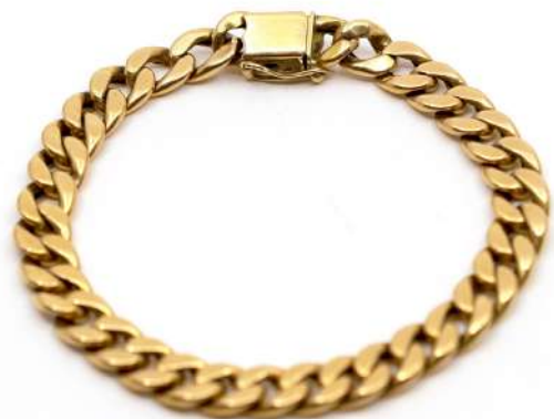
53| Bracelet gourmette en or jaune à mailles articulées.