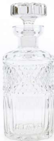
235| SAINT LOUIS (Dans le goût de) Carafe à whisky en cristal taillé. (Légère égrenure à l'intérieur du col).