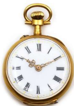
39| Petite montre de col en or à décor de ruban, rinceaux feuillagés et fleurettes. Double cuvette en or. Cadran émaillé blanc à chiffres romains. Poids brut : 14,5 g