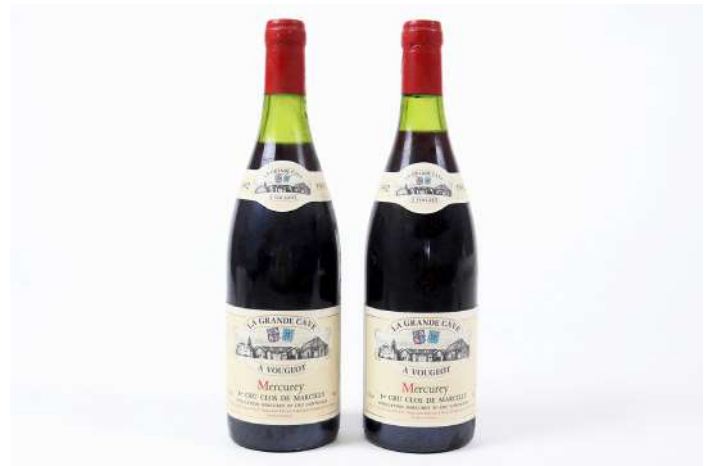
273| Ensemble de 2 bouteilles MERCUREY 1er Cru Clos de Marcilly 1992. (MB et LB).