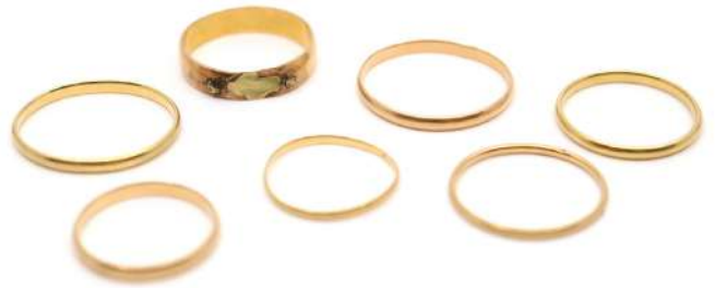
56| Ensemble de 7 alliances en or jaune. Poids : 11 g