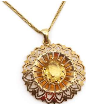
123| Pendentif en or jaune de forme circulaire à motifs ajourés rayonnants de cœurs et orné en son centre d'une citrine de taille ovale. Avec sa chaîne. Poids : 12,3 g