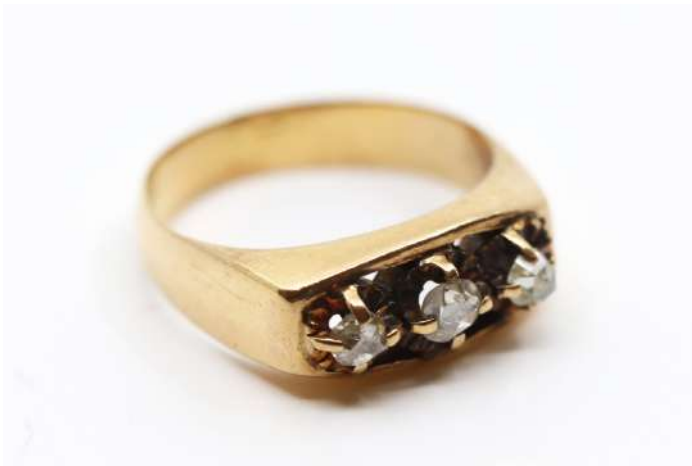
85| Bague en or jaune ornée de trois diamants taillés en rose. Poids : 6,2 g