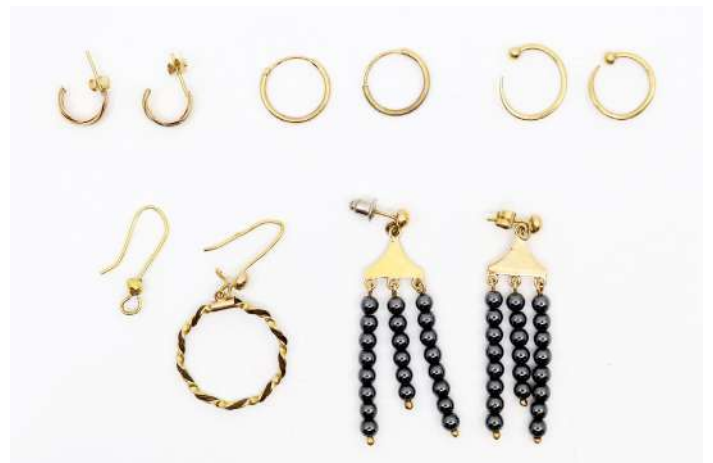
82| Lot de boucles d'oreilles en or.