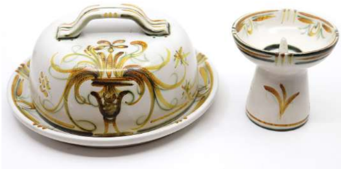
249| KERALUC à QUIMPER. Circa 1960-1970. Plateau à fromage et sa cloche en grès émaillé à décor polychrome de fleurs stylisées. Marque sous la base. On y joint un pique cierge assorti.