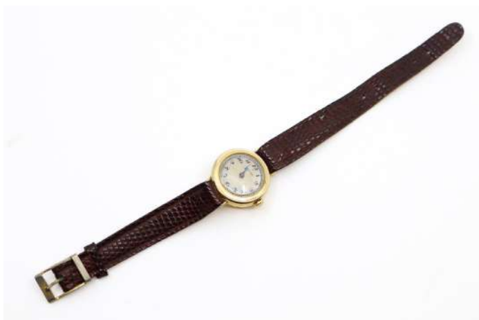
104| LONGINES Petite montre de dame en or jaune. Cadran à chiffres arabes signé. Bracelet rapporté."