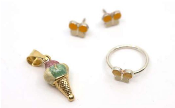
14| Lot de bijoux pour enfant comprenant : - une parure bague et boucles d'oreilles en argent émaillé à décor de papillons. - un pendentif en métal en forme de cornet de glace.