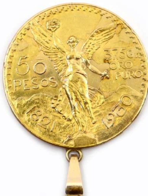
118| Pendentif en or orné d'une pièce de 50 pesos mexicaine.