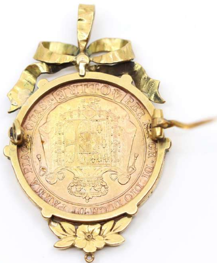
106| Pièce de 40 lres en or jaune montée en broche à décor de nœud et ornée d'une petite perle. Poids : 20,1 g