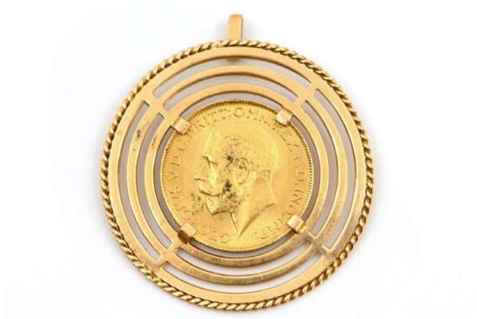
65| Pendentif en or jaune serti d'un Souverain George V en or daté 1928. Poids : 14,3 g