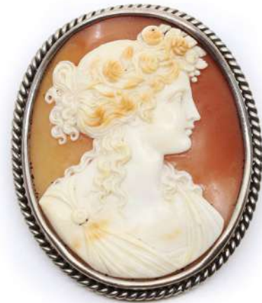
30| Importante broche en métal ornée d'un camée coquille sur agate représentant un buste de femme. Haut. : 5,2 cm