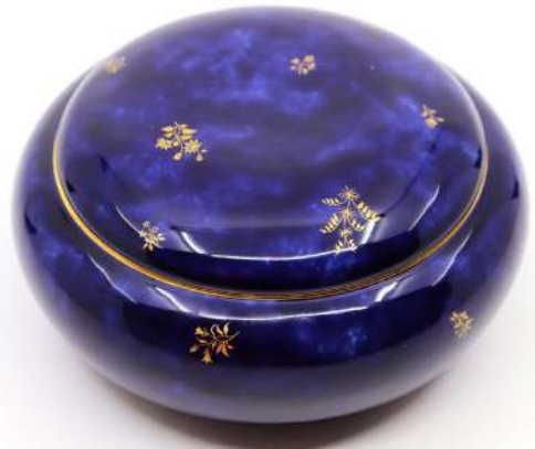
232| SÈVRES Bonbonnière en porcelaine émaillée à fond gros bleu et décor de fleurettes dorées. Marque Sèvres 1921. Monogramme MT. Diam. : 14 cm