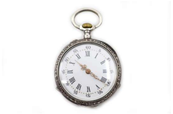
95| Montre de gousset en argent, cadran émaillé blanc à chiffres romains. Le dos à décor de feuillage.