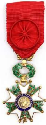
159| Légion d'honneur Ve République. Avec son ruban.