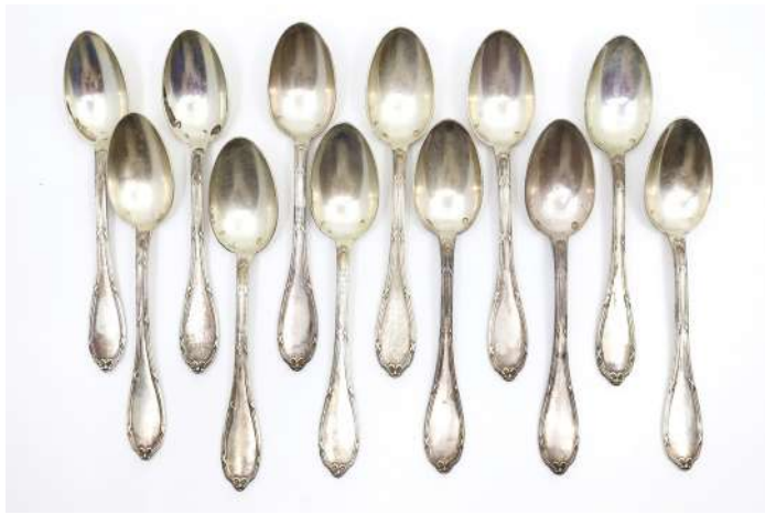
188| Ensemble de 12 petites cuillères en argent à décor de filets rubanés.