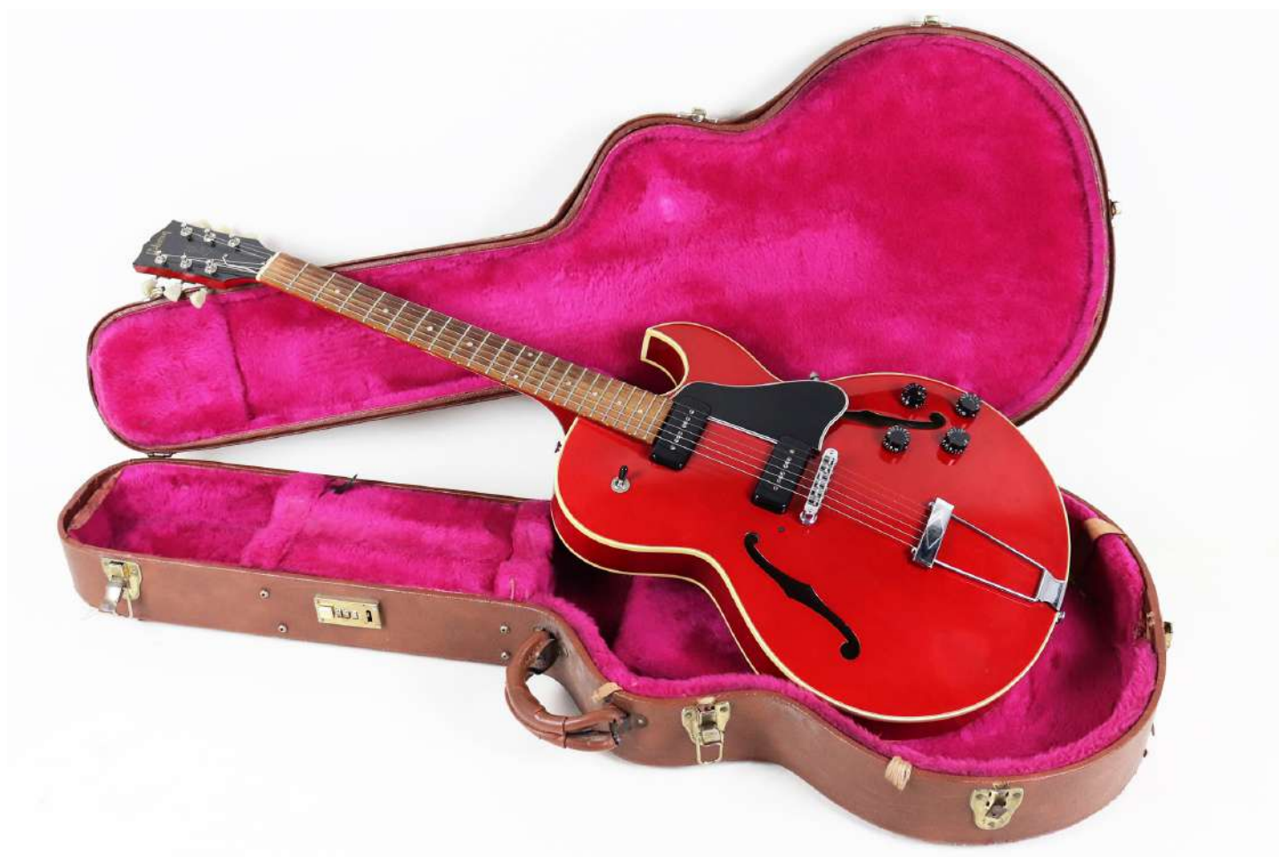
284| Guitare électrique modèle GIBSON ES 135 finition rouge. Made in USA en mars 1993. N° de série 90753308.