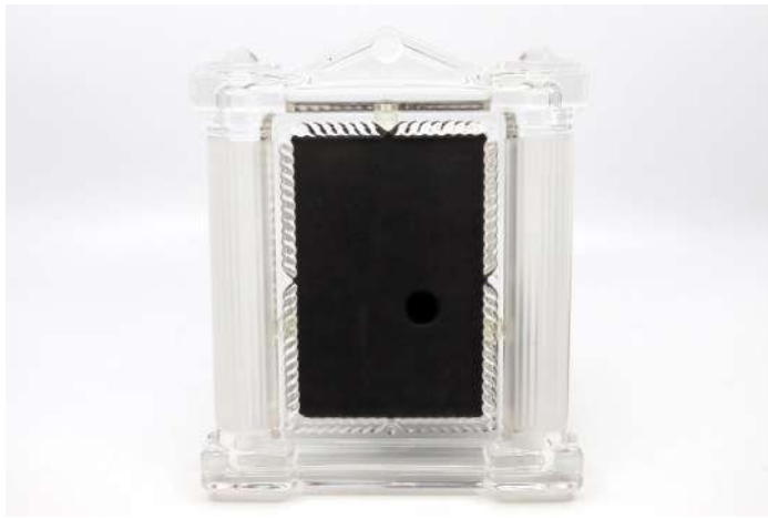
226| Cadre photo en verre moulé pressé à décor de temple néoclassique.