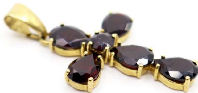
59,03| Pendentif croix en or jaune serti de 6 grenats. Poids brut : 7,5 g