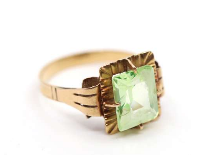
98| Bague en or jaune ornée d'une pierre de couleur de forme carrée. Poids : 3,6 g