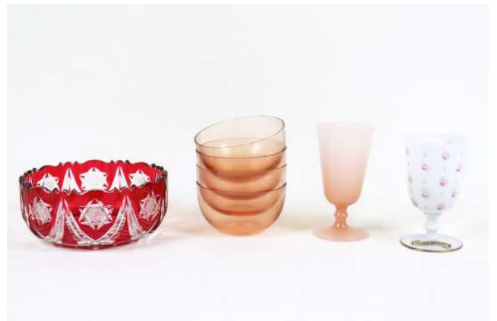
236| Ensemble comprenant un saladier en verre taillé transparent et teinté rouge, quatre coupelles en verre rose et deux verres sur piédouche en opaline