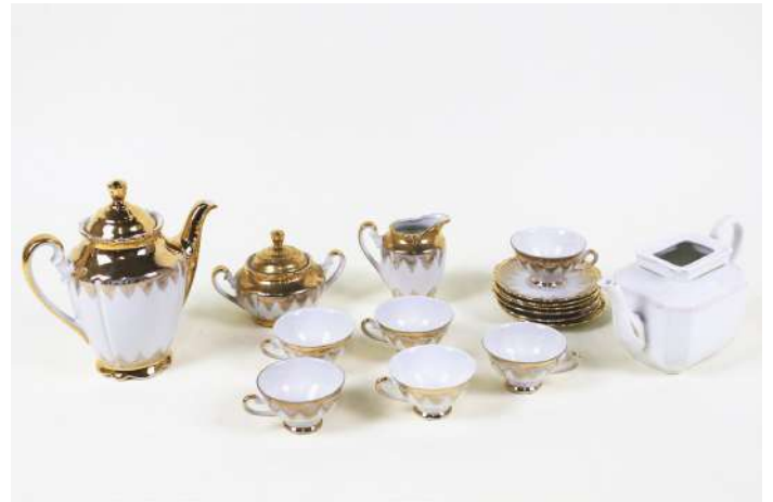
261| BAVIERE, XXe Partie de service à thé en porcelaine à décor de dorure comprenant une théière, un pot à lait, un sucrier, 6 tasses et sous-tasses. Marque Bavienthal. On y joint une théière en Paris (manque le couvercle).