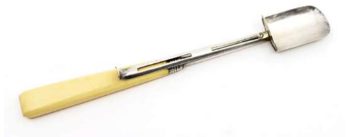
170| Cuillère à Stilton en argent avec mécanisme de poussoir, manche en ivoirine. Travail anglais. Long. : 22,5 cm