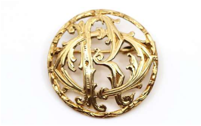
91| Broche en or jaune à décor ajouré de la lettre R et de feuillages stylisés. Poids : 9,3 g