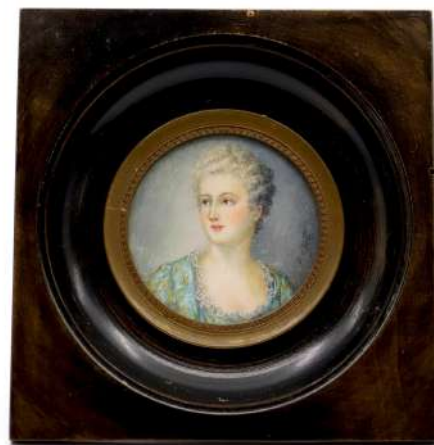
222| École FRANÇAISE du XIXe siècle Ensemble de trois miniatures sur ivoire : - Scène galante. Signée en bas à droite. Diam. : 7 cm - Éléante. Signée en bas à droite. Diam. : 6,5 cm - Portrait de femme. Signée à droite. Diam. : 5,5 cm Dans un cadre en bois.