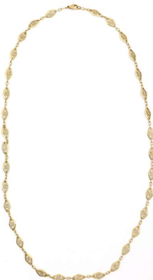
60| Ensemble de deux colliers à maillons navette ajourés et filigranés en or jaune. Poids : 30,8 g