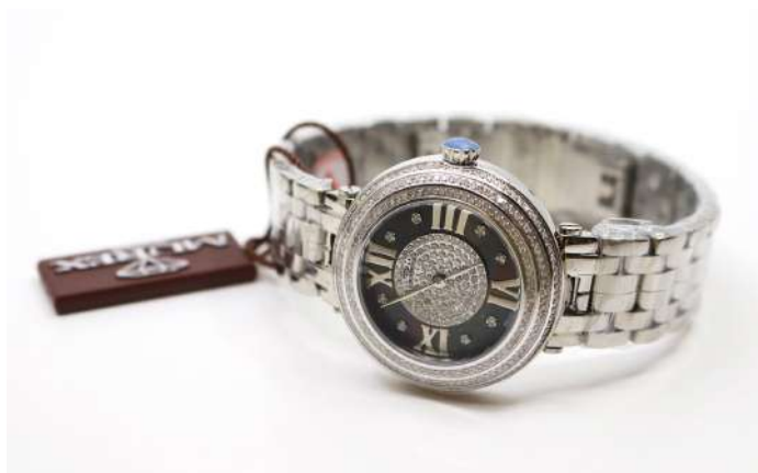
16| MUREX SWISS Montre bracelet de dame en acier, la lunette et le cadran sertis de 335 brillants (1,97 carats). Réf. RSL 972-SS-DD-8. Dans son écrin et avec certificat de garantie.