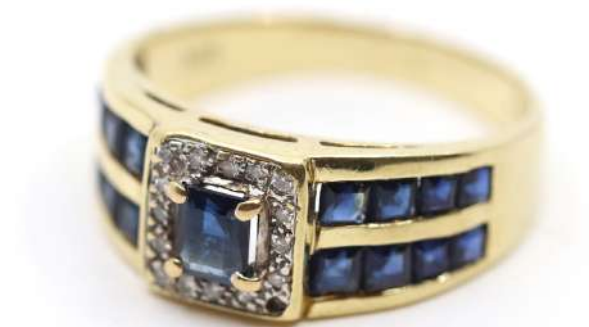
43| Bague en or jaune ornée en son centre d'un saphir taille carré ceint de petites roses et l'anneau pavé de saphirs en baguettes. (Manque un petit saphir). Poids : 4,4 g