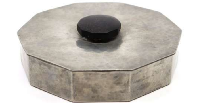
257| A. PETIT (XXe) Boîte couverte à pans en étain à décor martelé, la prise en bois. Haut. : 4 cm - Diam. : 17 cm