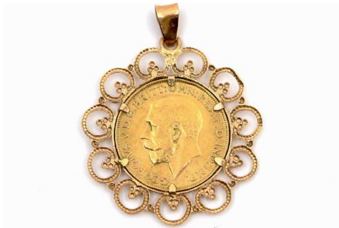
62| Pendentif en or jaune serti d'un Souverain George V en or daté 1928. Poids : 10,6 g