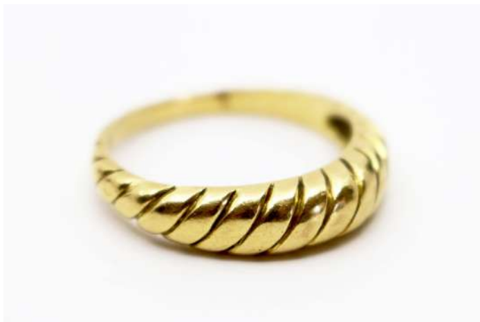
127,01| Bague en or jaune à côtes torses. TDD : 62 Poids : 5,5 g