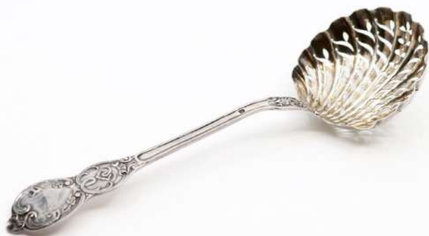
187| Cuillère saupoudreuse en argent, le manche violonné à décor de rinceaux feuillagés et coquilles. Poinçon Minerve. Poids : 47,8 g