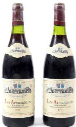
280| Ensemble de 2 bouteilles BOURGOGNE Les Armandières 1993. (LB).