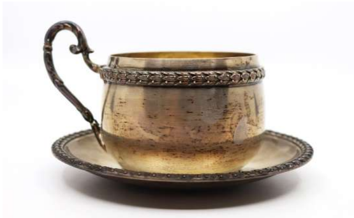
190| Tasse et sa sous-tasse en argent à décor de guirlande de laurier.

Marqué "Lovingly" sur la sous-tasse. Poinçon Minerve.