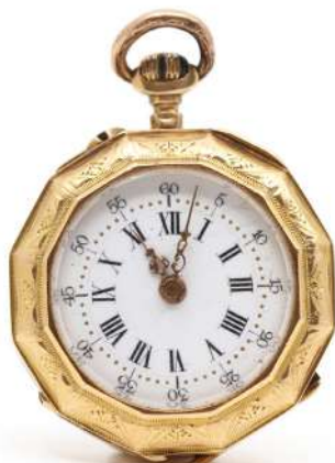
93| Petite montre de gousset en or jaune facetté à décor ciselé de guirlande feuillagée. Cadran émaillé blanc à chiffres romains pour les heures et arabes pour les minutes. Cuvette en or. Poids : 17,6 g