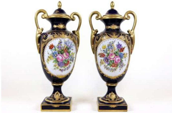
228| Dans le goût de SÈVRES Paire de vases couverts sur piédouche en porcelaine à fond gros bleu, décor de fleurs polychrome en réserve et rehauts de dorure. Haut. : 41 cm