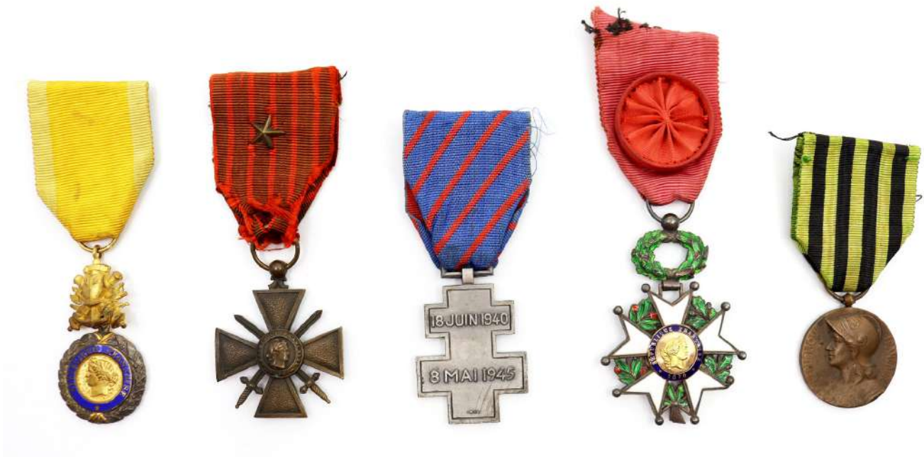
153| Lot de décorations françaises diverses dont médaille militaire troisième république avec son ruban, croix de guerre 1914/1917 avec son ruban décoloré et une étoile bronze, une croix de la France libre avec son module biface en métal et son ruban bleu à raies rouges obliques. Une étoile de Chevalier de la légion d'honneur troisième république en argent et émail avec son ruban à bouffette, et une commémorative de la guerre de 1870 module rond biface en bronze avec son ruban bleu à raies noire. (Etat 1-)