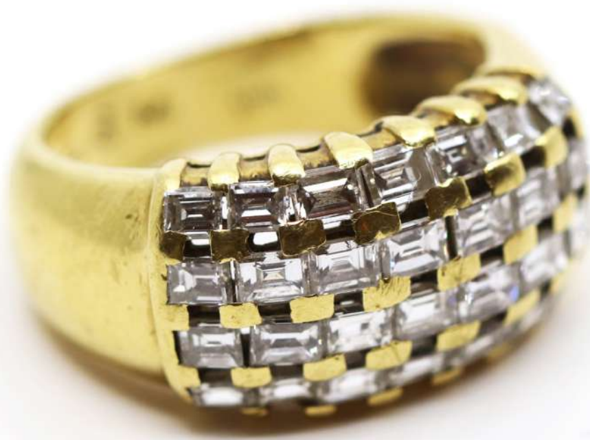
54| Bague dôme en or jaune à pavage de diamants baguettes. Poids : 7,6 g