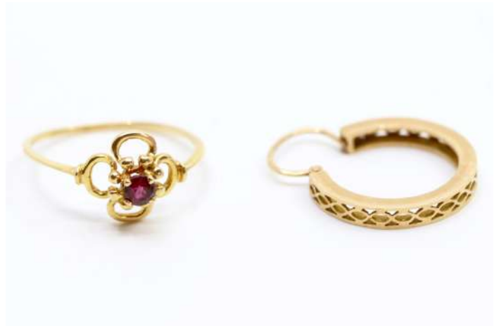
78| Bague en or jaune à décor ajouré de fleurette centrée d'une petite pierre rouge. TDD : 52. Poids brut : 1,2 g On y joint une boucle d'oreille créole en or jaune à décor filigrané. Poids : 1,3 g