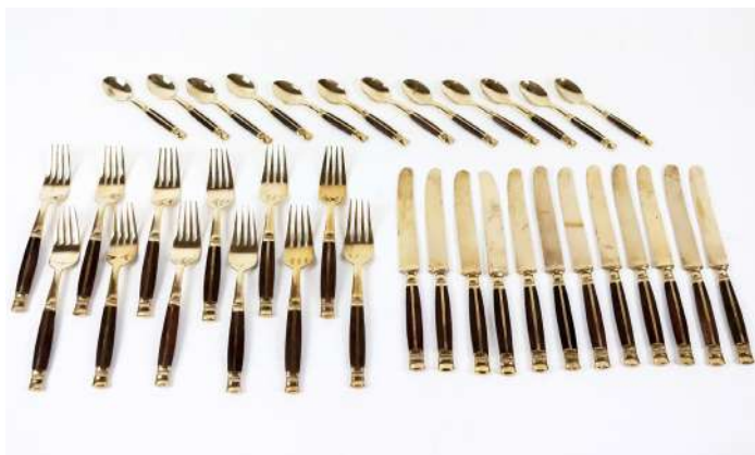
167| Ménagère en métal doré et manche partiellement en bois comprenant 12 couteaux, 12 fourchettes et 12 petites cuillères.