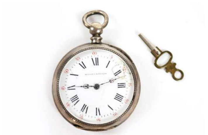
17| Montre de gousset en argent, le cadran émaillé blanc à chiffres romains signé Mouchet à Montluçon. Avec sa clé. (Accident).