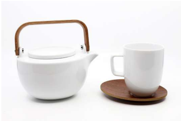
260| ASA SELECTION Théière en porcelaine et anse en bois et sa tasse sur coupelle en bois.