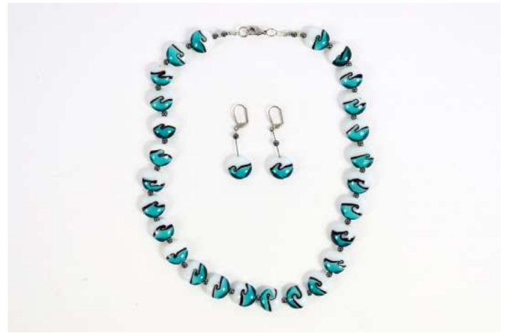
135| Demi parure comprenant un collier et une paire de boucles d'oreilles en perles de verre de Murano à décor bleu, blanc et noir.