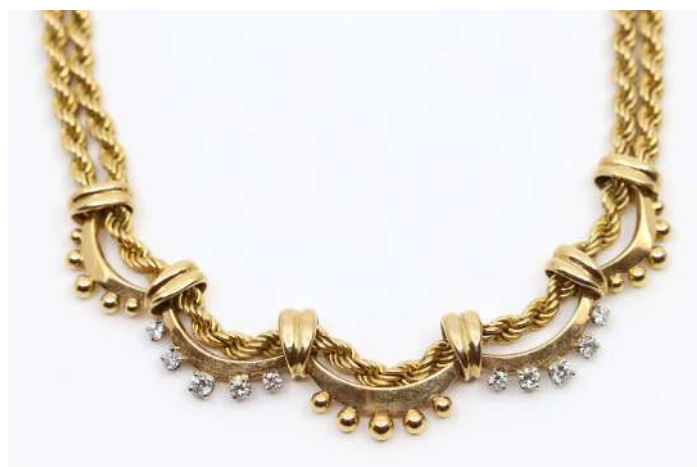
125| Important collier draperie en or jaune et platine, orné en alternance de perles d'or ou de diamants de taille décroissante. Poids : 90,6 g