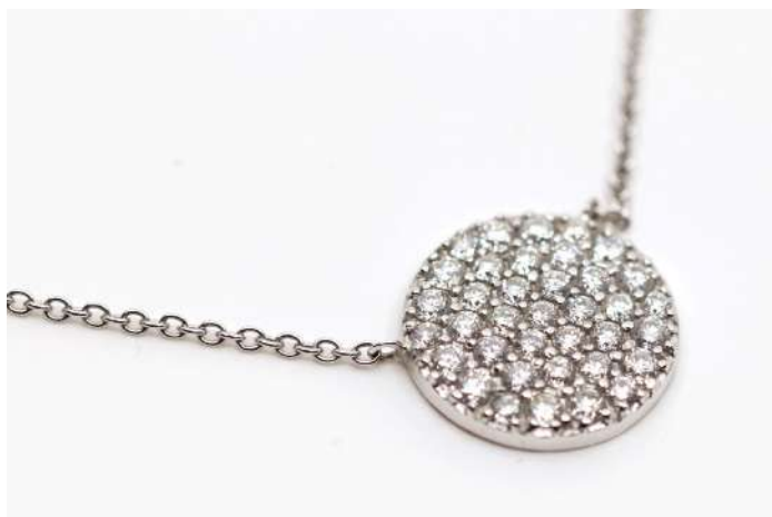
83| Collier en or gris orné d'un disque pavé de petits brillants.