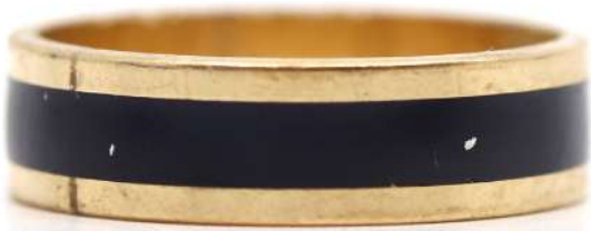
55| Bague anneau en or jaune partiellement émaillé noir. (Accidents). Poids net : 3,4 g