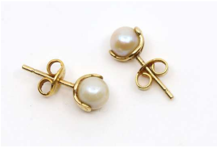
94| Paire de clous d'oreilles ornés d'une perle de culture, monture en or jaune. Poids : 1,5 g