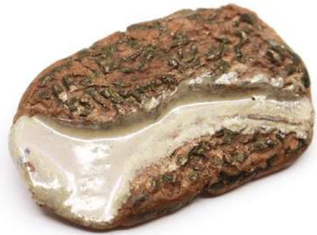
137| Annie ACQUART GENSOLLEN Paris Broche en céramique à décor en partie émaillé.