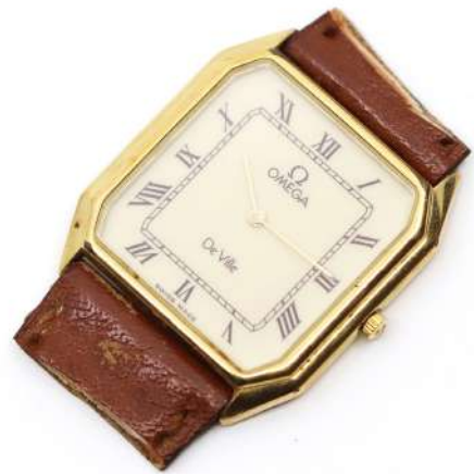
28| OMEGA, modèle de Ville Montre en métal plaqué or, cadran émaillé, index bâtons. (Manque le bracelet).