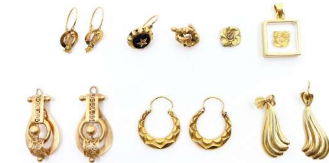
50| Ensemble de bijoux en or jaune comprenant notamment 3 paires de boucles d'oreille, deux petites dormeuses dépareillées, une paire de pendentifs à décor ajouré.