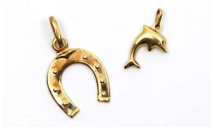
13| Ensemble pour enfant comprenant : - un pendentif en or jaune stylisant un fer à cheval. Poids : 1 g - un pendentif en or jaune stylisant un dauphin. Poids : 0,1 g