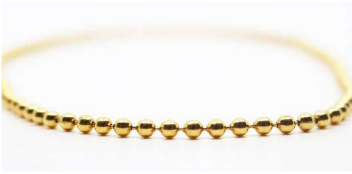
113| Collier composée de perles d'or jaune. Poids : 14,8 g