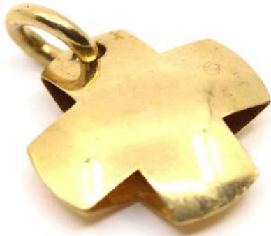
87| Croix pendentif en or jaune bombée. Poids : 2,8 g