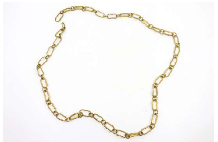
143| Ceinture de dame en métal doré à gros maillons forçat. Long. : 90 cm