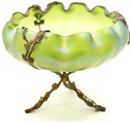
233| Johann LOETZ (1880-1940) [Attribué à] Coupe à bords polylobés en verre irisé vert et monture en bronze doré à décor de rinceaux feuillagés. Haut. : 16 cm - Diam. : 21 cm