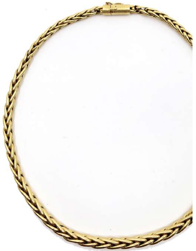
53,01| Collier à maillons palmier en or jaune. Poids : 30,5 g