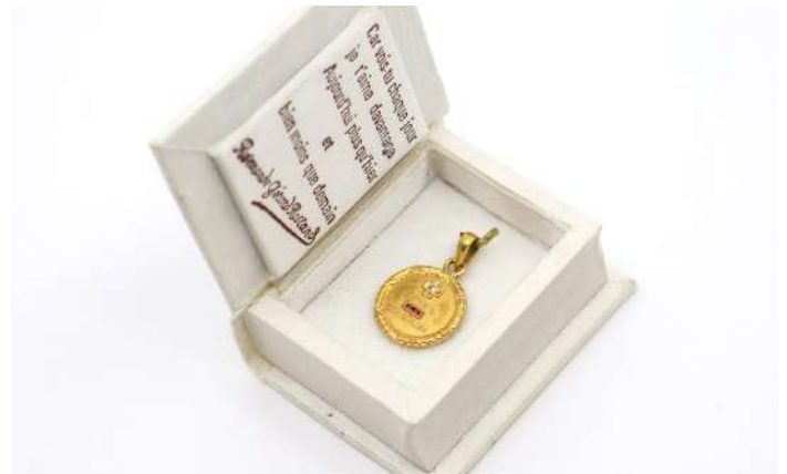
58| Médaille en or à décor d'une couronne de laurier et ornée d'une petite croix avec brillant "qu'hier, que demain". Dans son coffret. Poids net : 2,8 g