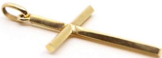
57| Croix pendentif en or jaune. Poids : 2,5 g