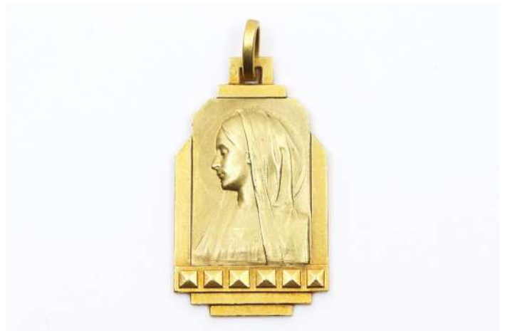
88| Médaille de baptême en or jaune de style art déco à décor du visage de la Vierge. Datée et chiffrée. Poids : 4,7 g