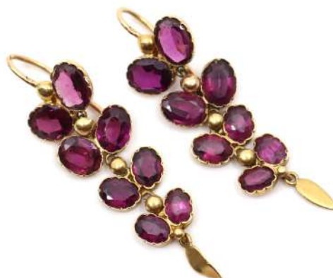
130| Paire de boucles d'oreilles en or jaune tombante ornée de grenat en serti clos stylisant une grappe. Poids : 4,1 g