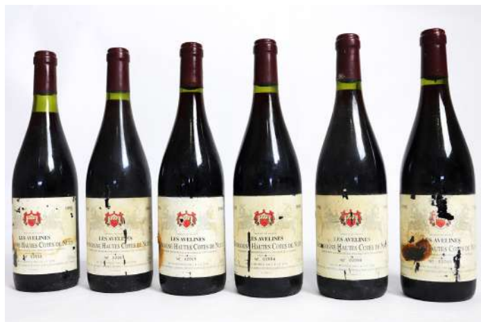
271| 6 bouteilles Bourgogne Hautes Cotes de Nuits Les Avelines, 1998 (5 bouteilles moins de 2 cm et 1 bouteille entre 2 et 4 cm). (Étiquettes abimées). 15/30€