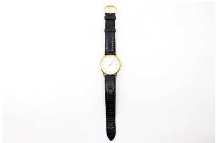
86| JAEGER LECOULTRE Montre d'homme en or, le cadran à index bâtons, fenêtre date à 3 heures. Bracelet cuir rapporté.