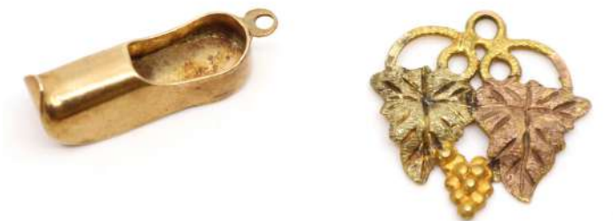
70| Ensemble de deux pendentifs en or à décor de sabot pour l'un (Poids : 1,4 g) et de pampres de vigne pour l'autre (Poids : 0,9 g).