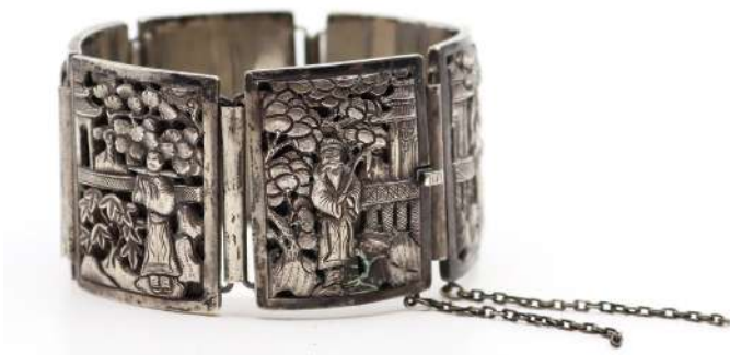
23| Bracelet manchette en argent articulé, ajouré et ciselé à décor de personnages orientalisants. Poids : 59,3 g