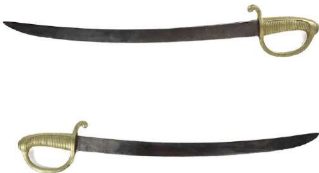
163| Sabre briquet modèle AN IX, marquage illisible au dos de la lame sans fourreau. État 2.