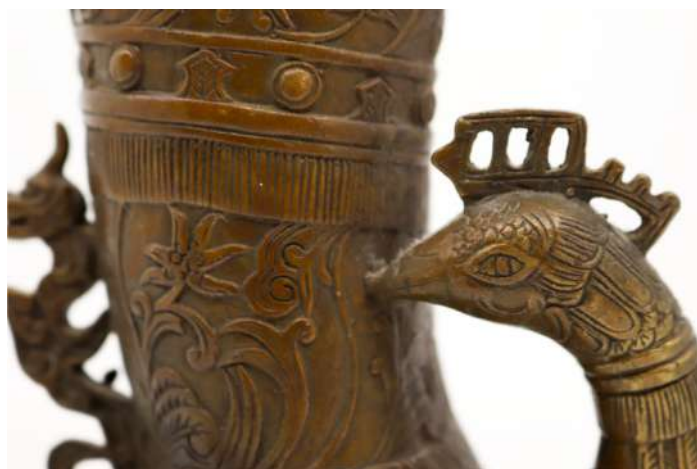
186,01| CHINE, Fin du XIXe - Début du XXe Rhyton en bronze à décor de phénix sur l'anse. Marque apocryphe sous la base "Khang Hy Nien Che" signifiant "Fait à l'époque de Kangxi". Haut. : 16,5 cm