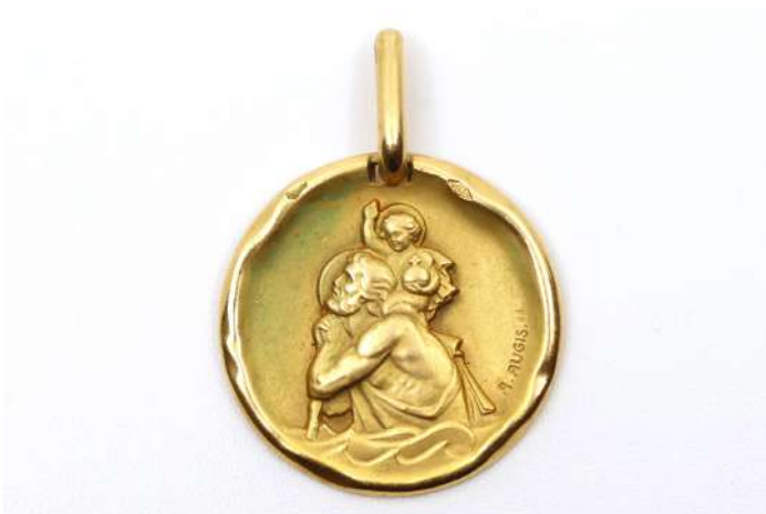
89| Médaille de baptême en or jaune à décor d'un Saint Christophe. Poids : 3,4 g