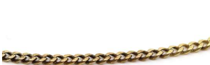
46| Chaîne en or à mailles articulées. Poids : 8,8 g