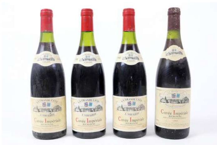
270| Ensemble de 4 bouteilles BOURGOGNE Cuvée Impériale 1990 (x3) et 1993 (x1). La Grande cave à Vougeot Négociant. (LB à MB). 40/50€