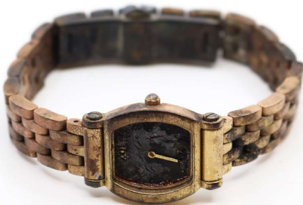
38| Montre en or jaune. Poids : 53,1 g (Accidents).