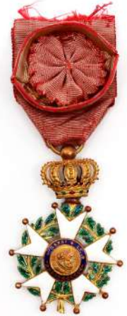
160| Belle croix d'officier de la légion d'honneur époque monarchie de juillet beau bijou en or et émaux, anneau bélière canelé sous couronne mobile articulée. Branches pommetées (certaines pommettes légèrement faussées, quelques éclats minimes à l'émail blanc des branches tant à l'avert qu'au revers Manques aux émaux vert des feuilles au revers. Avec son ruban à bouffette insolé. Taille 42,77 mm sans la couronne X 41,74 mm. Poids brut : 21 g (avec ruban) (État 1-)