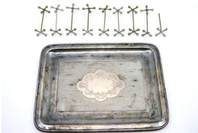
169| Ensemble en métal argenté comprenant : - un petit plateau rectangulaire à fond guilloché orné au centre de rinceaux feuillagés. - neuf porte-couteaux, supports en croisillons. (Accidents et manques).