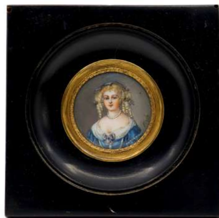
223| École FRANÇAISE du XIXe siècle Ensemble de trois miniatures sur ivoire : - Portrait de femme. Signée en bas à droite. Diam. : 4 cm - Portrait de femme d'après Winterhalter. Signée en bas à droite. Diam. : 5,5 cm - Portrait de femme. Haut. : 8,5 cm Dans un cadre en bois et laiton.