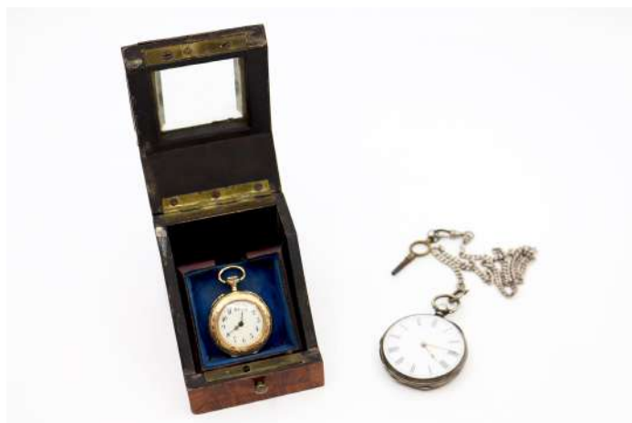
64| Petite montre à gousset en or à décor de rinceaux et fleurettes, cadran émaillé blanc à chiffres arabes.