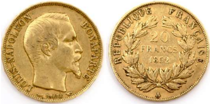
67| Napoléon III, 20 FRANCS or Tête nue 18. Poids : 6,4 g