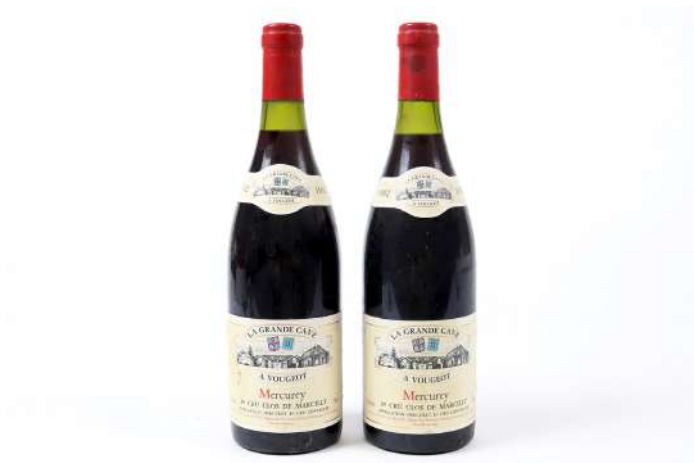
268| Ensemble de 2 bouteilles MERCUREY 1er Cru Clos de Marcilly 1992. (LB). 30/40€