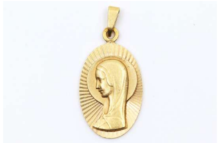
80| Médaille de baptême en or jaune de forme ovale à décor du visage de la Vierge sur un fond rayonnant.