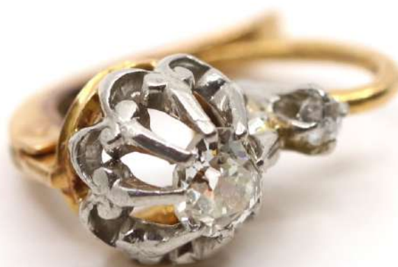
133| Paire de boucles d'oreilles en or jaune ornée de deux diamants de taille ancienne d'environ 0,10 carat.