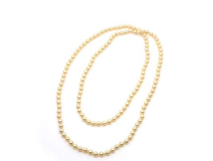
96| Important sautoir en perles de cultures. Long. : 120 cm