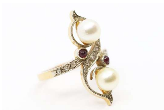
132| Bague toi et moi en or jaune ornée de deux perles de culture, deux petits rubis en cabochon et d'un pavage de petites roses.