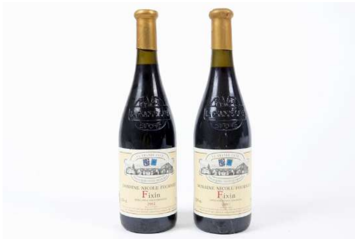
272| Ensemble de 2 bouteilles FIXIN Domaine Nicole Fournier 2002. (LB).