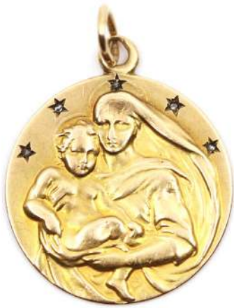
79| Médaille de baptême en or jaune à décor d'une Vierge à l'Enfant avec petites étoiles. Chiffrée et datée.