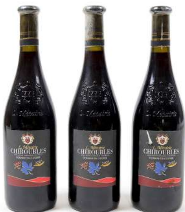
282| Ensemble de 3 bouteilles CHIROUBLES Domaine du Clocher 2001. (J).