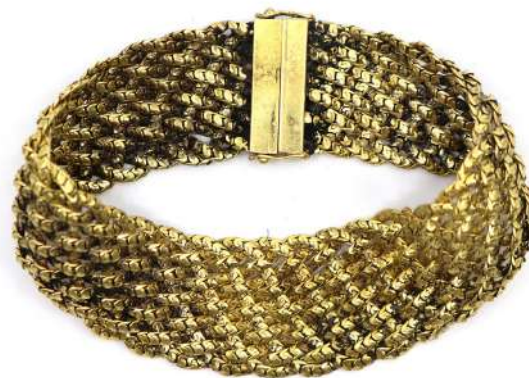
40| Bracelet en or à mailles plates articulées. Poids : 63,7 g