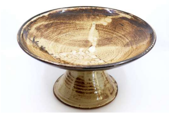
256| Henri UCHEDA (XXe) Importante coupe sur piédouche en terre cuite émaillée à décor en camaïeu brun. Monogrammé HU à l'intérieur du pied. Haut. : 18 cm - Diam. : 33 cm