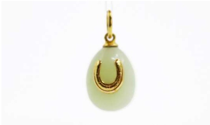
141| ILIAS LALAOUNIS Pendentif formant un oeuf en jade, repercé d'un fer à cheval en or jaune. Bélière en or jaune 18K. Haut. (bélière comprise) : 2,3 cm