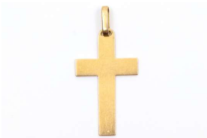
59| Croix pendentif en or jaune. Poids : 1,4 g