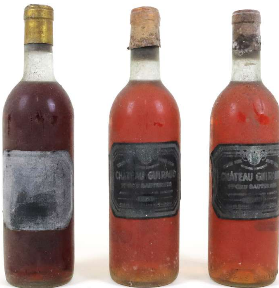
265| Ensemble comprenant : - 1 bouteille 1er Cru SAUTERNES Château Guiraud 1963. (TLB - ELS - CAPS AB) - 1 bouteille 1er Cru SAUTERNES Château Guiraud 1965. (TLB - ELS - CAPS AB). - 1 bouteille 1er Cru SAUTERNES Château Guiraud 1967. (TLB - ETS - CAPS AB).