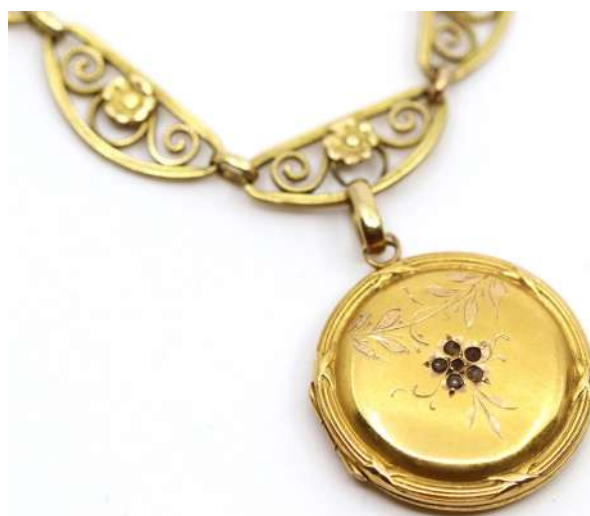
121| Pendentif porte-photo en or jaune de forme circulaire à décor ciselé de fleurette et faisceau. On y joint une chaîne de montre en or jaune à mailles ajourées.