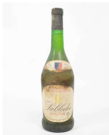
264| 1 bouteille Sabledoc Cuvée Saint Louis, Vin de Pays des Sables du Golfe du Lion (TLB).