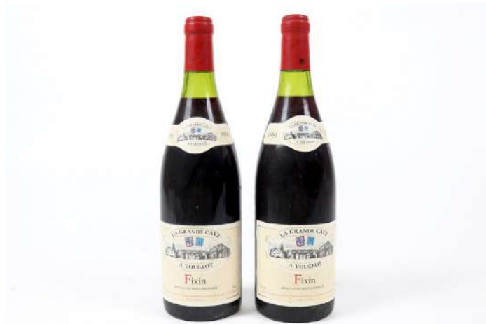
267| Ensemble de 2 bouteilles FIXIN 1991. (LB). 40/50€