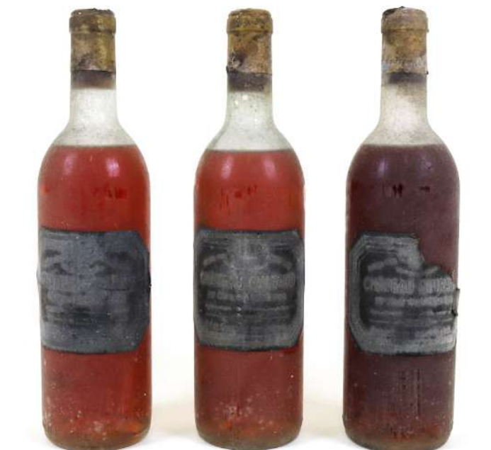
276| Ensemble comprenant : - 2 bouteilles 1er Cru SAUTERNES Château Guiraud 1962. (HE - 1 ETA - ETS - CAPS AB). - 1 bouteille 1er Cru SAUTERNES Château Guiraud 1964. (HE - ETS - CAPS AB).