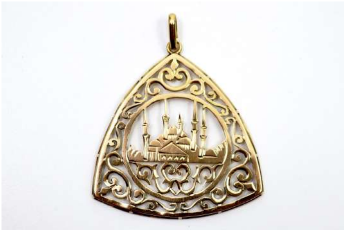
68,01| Pendentif en or 14K à décor ajouré de la cathédrale Sainte Sophie. Poids : 5,6 g