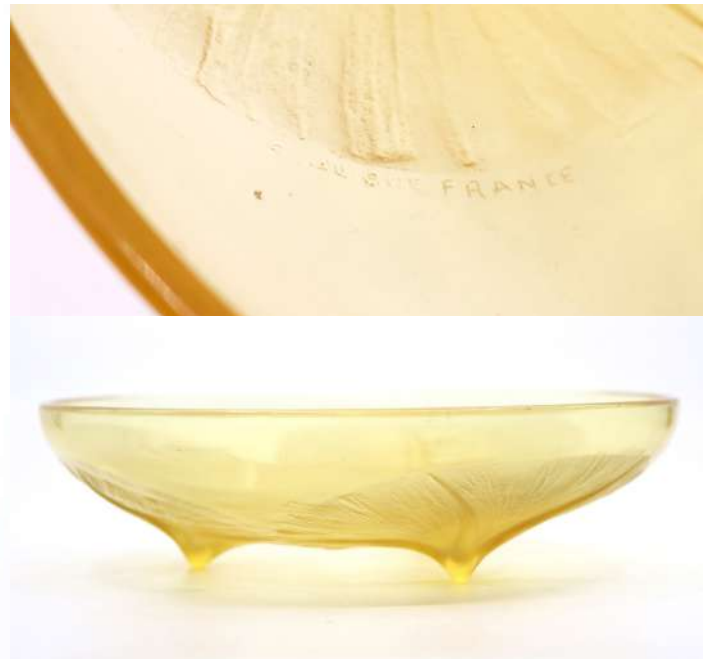
245| René LALIQUE (1860-1945) Coupe modèle Volubilis en verre moulé pressé légèrement teinté jaune. Signature moulée R. LALIQUE et marquée «France» à la pointe. Haut. : 5,5 cm - Diam. : 21,5 cm Modèle figurant aux catalogues de 1928 et de 1932, épuisé en 1939, non repris après 1947.