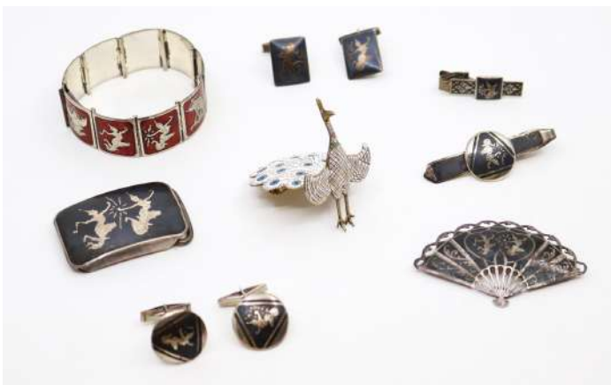
25| Ensemble en argent "Siam Sterling" et décor en émail cloisonné comprenant notamment une broche éventail, une broche Paon, deux paires de boutons de manchettes, une boucle de ceinture, un bracelet et deux pinces. Poids brut : 113,8 g