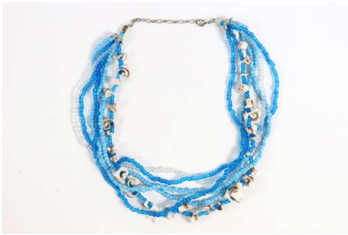
134| Ensemble comprenant un collier à six rangs de petites perles bleues et coquillages et un sautoir en graines naturelles "Larmes de Job"