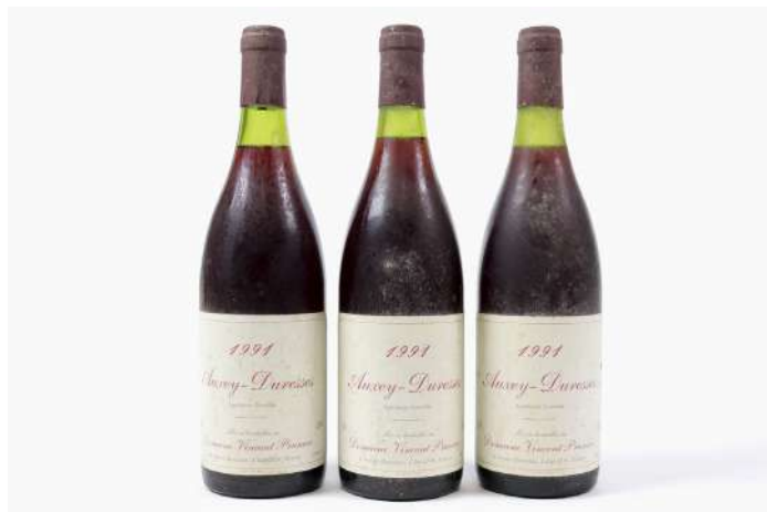
269| Ensemble de 3 bouteilles AUXEY-DURESSES 1991. (LB - ELS). 50/70€