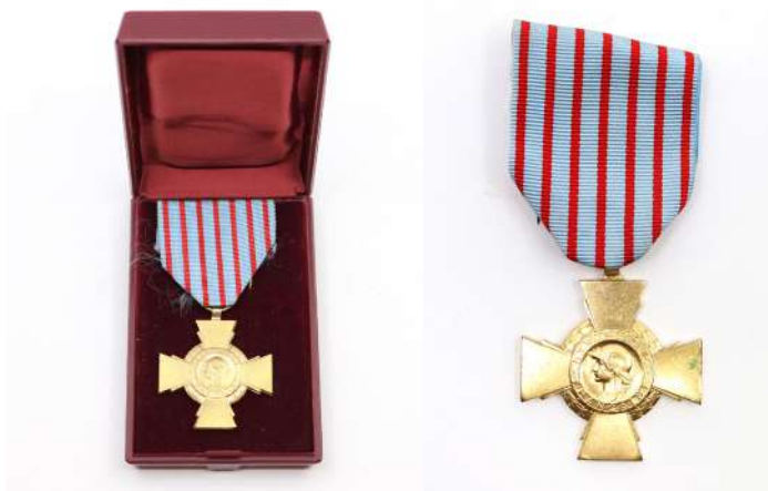
154| Ensemble de deux décorations modernes. Dans leur coffret.