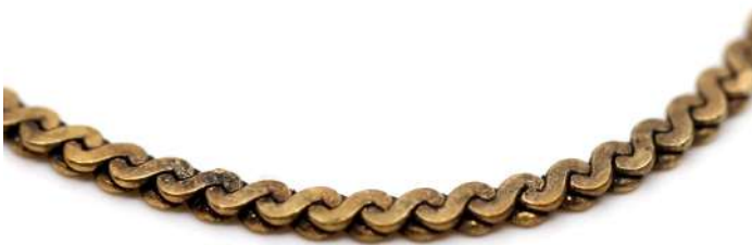
42| Chaîne en or à mailles plates. Poids : 13,8 g (Accidents)