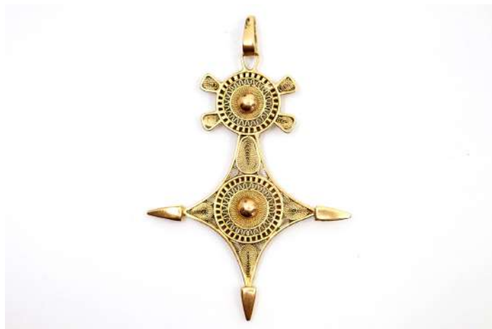
44,01| Pendentif Croix du Sud ou Croix berbère en or jaune 18K. Poids 17,6 g