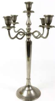
186| Important candélabre en métal argenté à 5 bras de lumière. Haut. : 55,5 cm - Larg. : 34 cm (Manques).