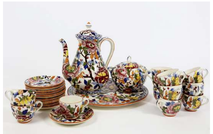
252| GIEN Service à thé modèle "Pivoines" comprenant une théière, un sucrier, 12 tasses et sous-tasses et un plateau.