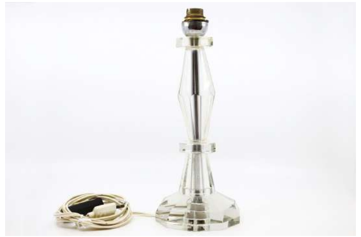
248| Pied de lampe en plexiglas de forme balustre. Circa 1950. Haut. : 28 cm