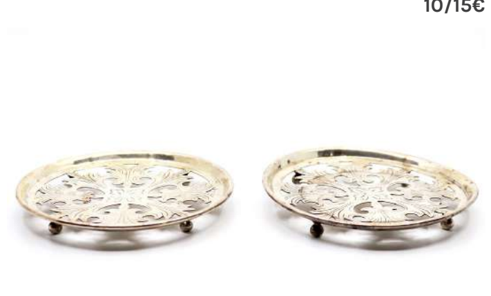
191| Ensemble de deux dessous de bouteille en métal argenté posant sur des pieds boules, à décor ajouré de feuillage stylisé.