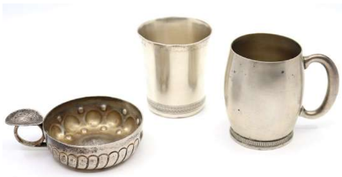
192| Ensemble en argent, poinçon Minerve, comprenant une tymbale à col évasé et un tastevin, la prise chiffrée.