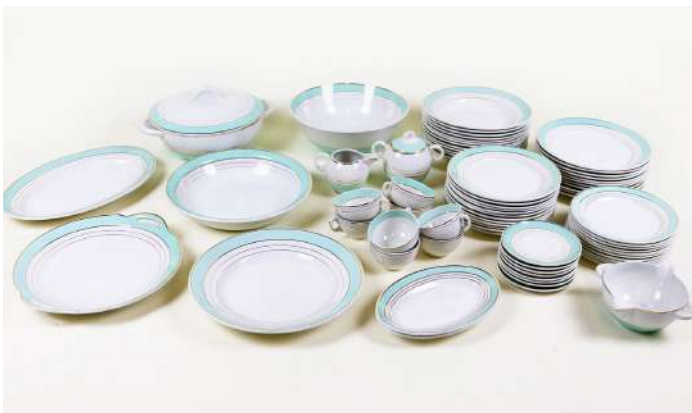
258| LUNEVILLE Importante partie de service de table modèle "Régence" en porcelaine opaque à décor de filets vert céladon et dorés, comprenant assiettes, soupière, plats de service, service à thé.