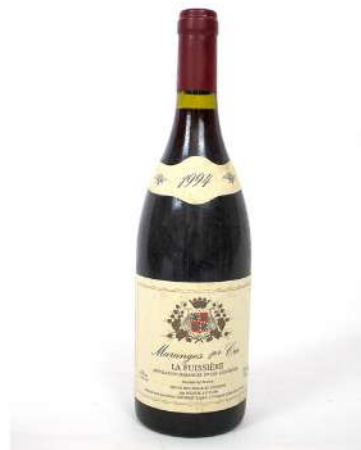
283| 1 bouteille "La Fuissière", Maranges 1er Cru, 1994 (2-4C).