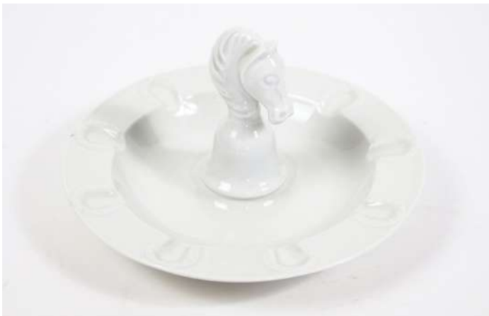
251| HAVILAND - Limoges Cendrier à cigares en porcelaine émaillée blanche, la prise à décor d'une tête de cheval stylisée. Haut. : 13 cm - Diam. : 22 cm