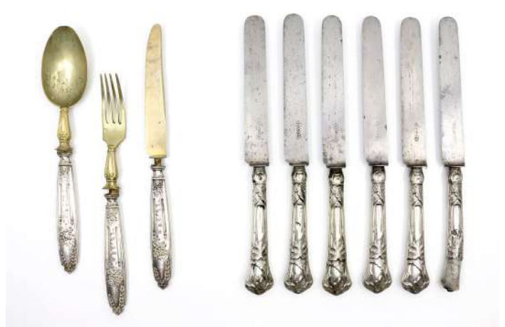
166| Ensemble de six couteaux à fromage, lame métal, manche en argent fourré à décor de feuilles de vigne. (Un accidenté). On y joint un couvert de baptême comprenant cuillère, fourchette et couteau, en métal doré, manches en argent fourré à décor de nœud, rinceaux de style Louis XVI.