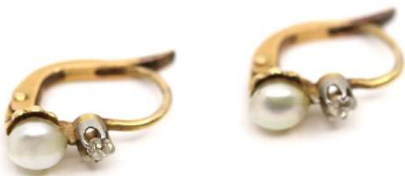
124| Paire de petites boucles d'oreilles en or jaune ornée d'une perle et d'une petite rose. Poids : 2,1 g