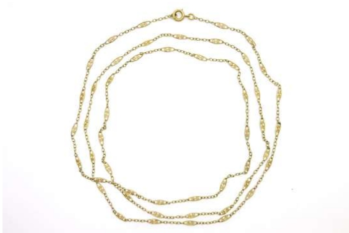
61| Important sautoir en or à maillons filigranés. Poids : 21,9 g