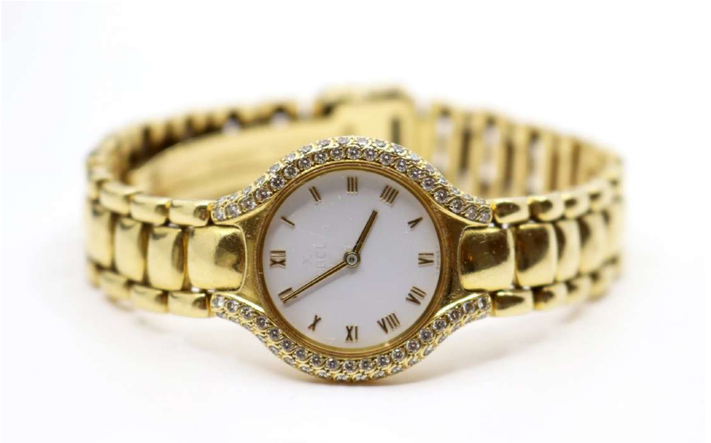
41| EBEL, modèle BELUGA Montre de femme en or jaune, cadran émaillé blanc à chiffres romains ceint de petites roses, bracelet à mailles articulées. Poids : 69,9 g Dans son coffret, avec son certificat.