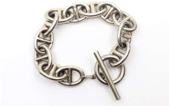
27| HERMÈS (dans le goût de) Bracelet gourmette à mailles articulées en argent. Poids : 82,6 g