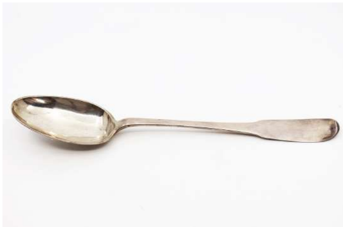
165| Cuillère à ragoût en argent uniplat. Chiffrée EL. XVIIIe siècle. Poids : 157,6 g