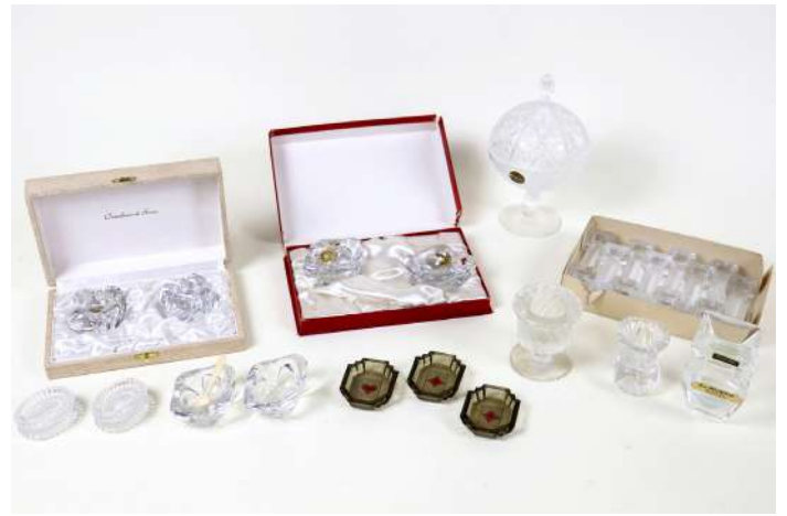
227| Ensemble en verre et cristal comprenant quatre paires de salerons dont cristal de Sèvres (deux paires dans leur coffret), 3 petits salerons en verre fumé, 8 porte-couteaux en verre moulé, deux petits vases soliflores dont un en cristal de Sèvres, une bonbonnière en verre taillé et un bougeoir en verre moulé pressé sur piédouche signé Lalique France.