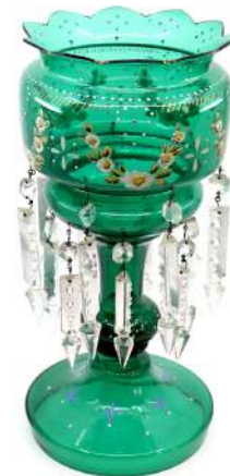
229| Porte-ananas sur piédouche en verre teinté vert à décor émaillé de guirlandes fleuries, des pendeloques de cristal en myrza ornent sur deux niveaux la partie basse. Époque Napoléon III. Haut. : 36,5 cm