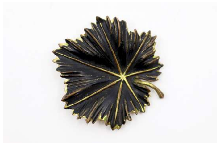
26| Broche stylisant une feuille en métal doré et noir.