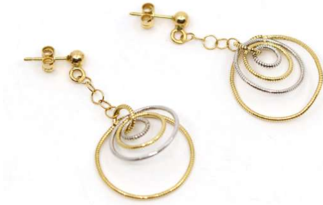
48| Paire de boucles d'oreilles en or, à décor de spirales tubogaz deux tons.