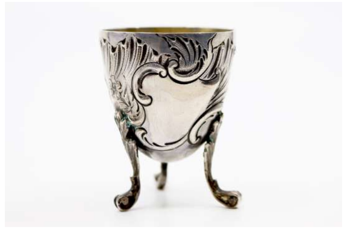
189| Coquetier en argent, intérieur vermeillé posant sur trois pieds à enroulements feuillagés, à décor de fleurettes et coquilles.