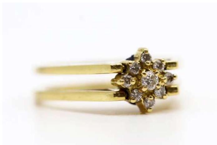
47| Bague réversible en or jaune avec d'un côté un saphir en taille ovale, de l'autre une petite marguerite de diamants. Poids : 6,4 g