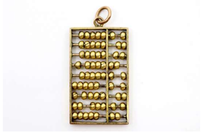
68| Pendentif à décor de boulier en or jaune 14K. Poids : 7,8 g