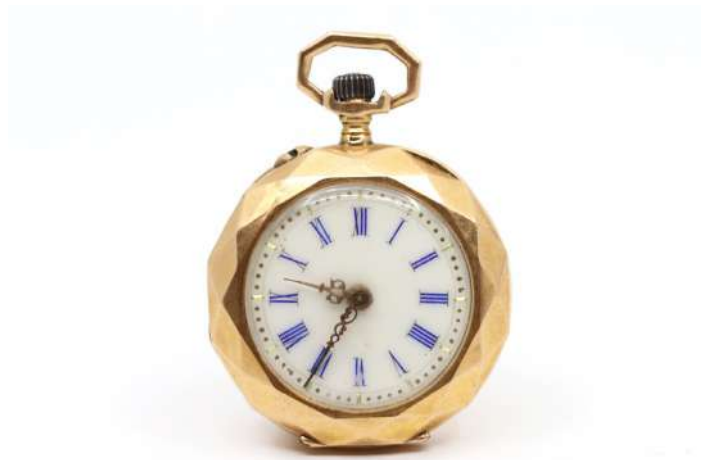
99| Petite montre de gousset en or jaune facetté à décor ciselé de fleurettes. Cadran émaillé blanc à chiffres romains. Cuvette en or.