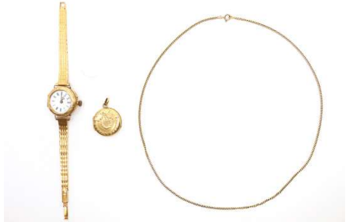
49| Ensemble de bijoux en partie en or jaune comprenant une montre de col montée en montre bracelet, une montre de col et une chaîne à maillons forçat.