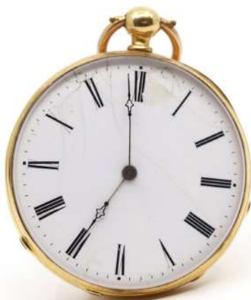
117| Montre à gousset en or jaune à décor ciselé d'un médaillon et d'une guirlande feuillagée. Cadran émaillé blanc à chiffres romains. Cuvette intérieure en or. Poids : 57,3 g