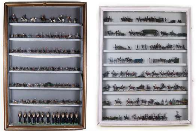
152| ETAIN PLAT, 35/40 mm environ Importante collection de soldats présentés dans leur vitrine d'exposition (Une vitre cassée). Haut. : 112,5 cm et 79,5 cm - Larg. : 82 cm et 63,5 cm On y joint deux vitrines d'exposition vides. Haut. : 82 et 56 cm - Larg. : 60 et 71,5 cm