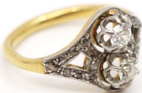
120| Bague en or jaune et or gris ornée de deux diamants de taille ancienne d'environ 0,20 carats chaque et de petites roses.