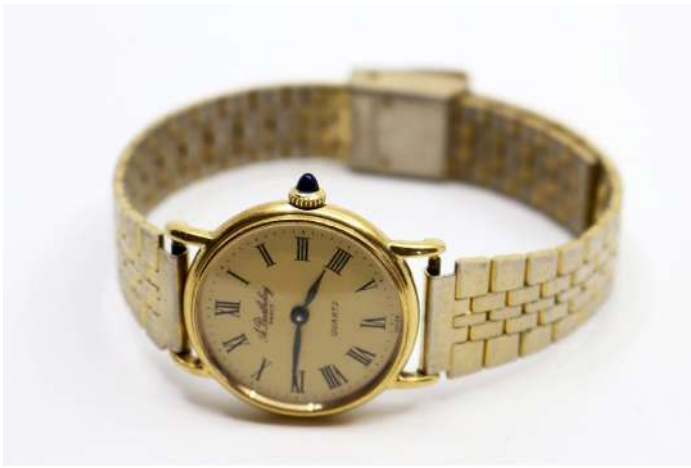
21| A. BERTHELAY Montre bracelet de dame en acier doré. Le boîtier rond à cadran doré et index à chiffres romains. Signée. (Usures).