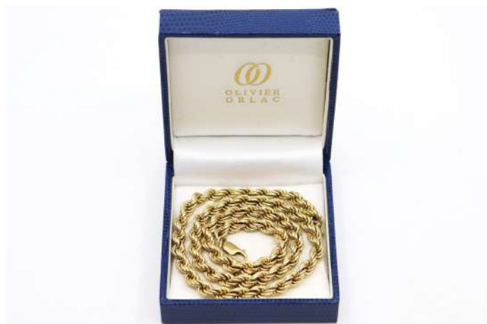
46,01| Collier en or jaune à mailles corde. Poids : 18,5 g