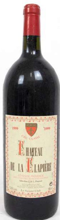
283,01| 1 Magnum Château de la Clapière, Côtes de Provence, 1999 (TLB).