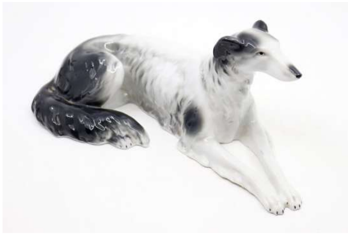
231| Carl SCHEIDIG (XIX-XXe), Manufacture Gräfenenthal, Thuringe (XXe) Barzoï couché Sujet en porcelaine émaillée. Marque sous la base. Haut. : 8,5 cm - Long. : 21 cm