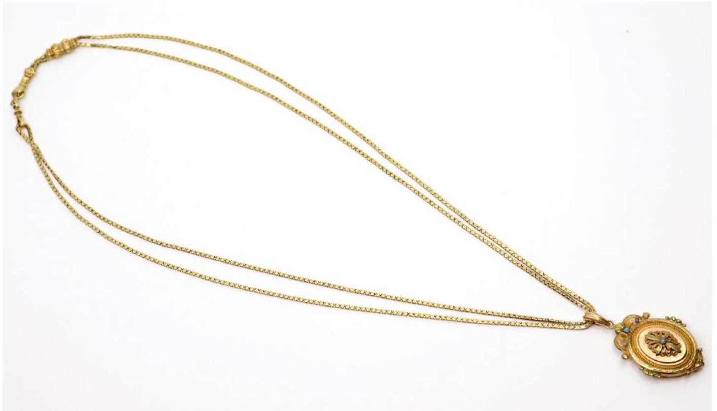
103| Pendentif en or jaune et rose formant médaillon porte-photo à décor de feuillages stylisés et orné de petites perles et perles de turquoise. On y joint une double chaîne à mailles plates articulées, fermoir stylisant un poing ganté. Poids : 33,9 g