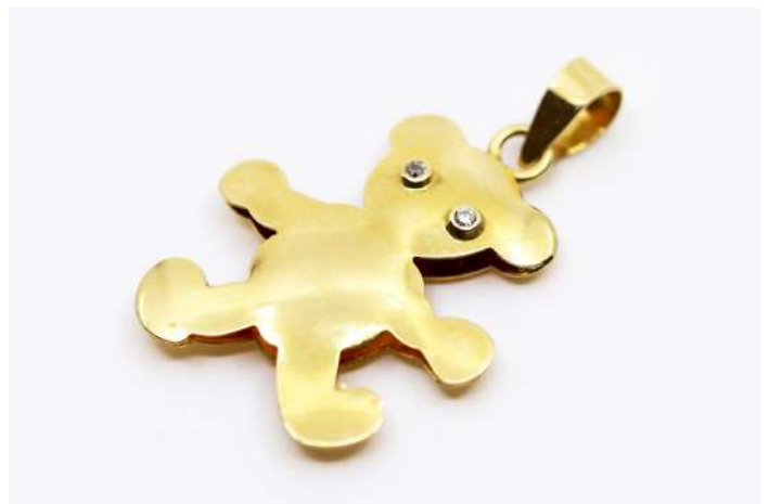
90| Petit pendentif en or jaune stylisant un nounours, les deux yeux avec inclusion de petite rose. Poids : 1,7 g