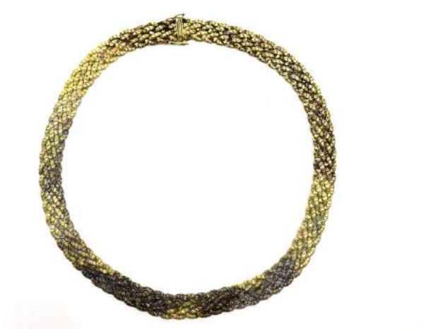
44| Collier en or à mailles plates articulées. Poids : 62,39 g (Accident).