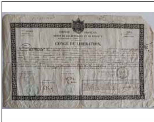
9 Congé de libération pour un chasseur du cinquième bataillon de chasseur à pied. Fait à Albi le 31 décembre 1865. 20/30 €