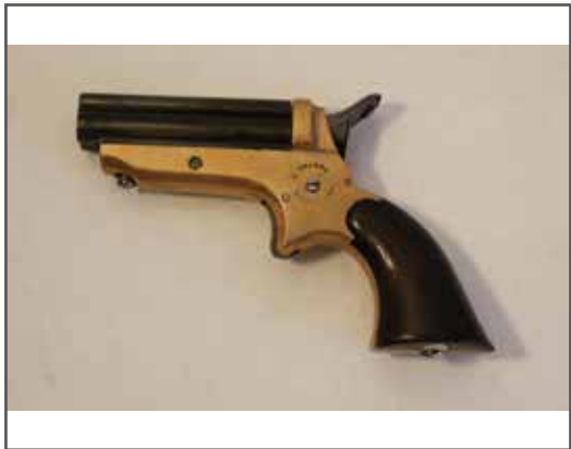
64 Intéressant pistolet Sharps d'origine à 4 coups en calibre 22 short. Arme numéro 17650, bâti bronze signature Sharp et brevets, canon bronzé, chien à percuteur rotatif, plaquettes en bois de rose, mécanisme fonctionnel. État 1. Catégorie "D". 400/500 €