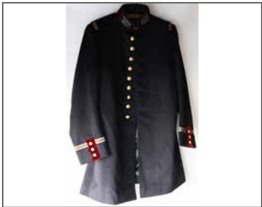
43 Manteau en drap peigné noir d'un médecin militaire de la marine, vers 1900. Col droit rouge carmin au ca- ducée, canetille dorée sur canapé noir. État 1-. 40/60 €