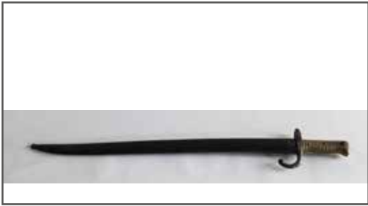
83 Baïonnette Yatagan française modèle 1866 d'in- fanterie. Fabrication tar- dive (Tulle, juin 1873). Fourreau acier bronzé au numéro. État 1. 40/60 €