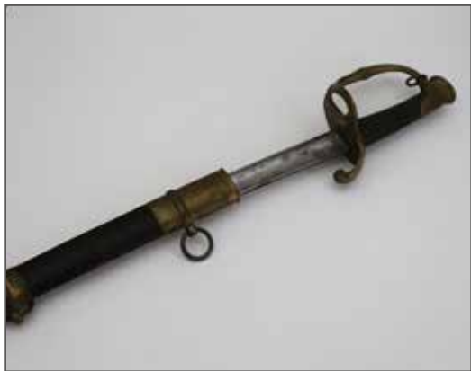
81 Sabre d'officier d'infanterie modèle 1821. 250/300 €