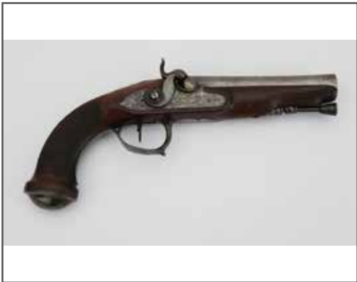
63 Pistolet primitivement à silex transformé à percussion. Fabrication contemporaine du Premier Empire, signature sur le corps de platine « Cuillieron à Grenoble » en cursives. 250/300 €