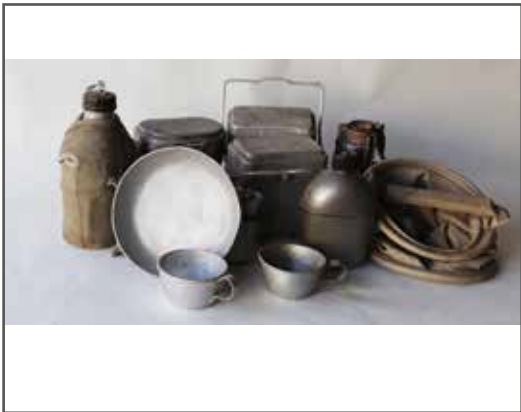
16 Lot de matériel de campe- ment militaire (quart, gamelle allemande, réchaud, etc.). État 2. 20/30 €