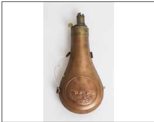
54 Belle poire à poudre en cuivre rouge, corps symétrique, un cartouche en relief ovale présente deux chiens à l'arrêt. Mécanisme fonctionnel. Etat 2. 40/60 €