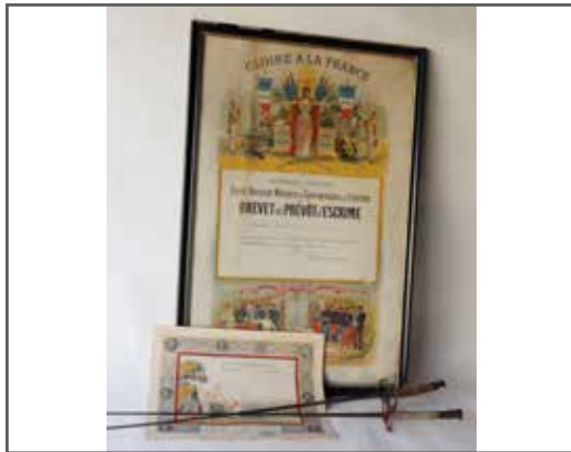
17 Lot sur le thème de l'es- crime comprenant deux fleurets, un diplôme de prévot d'escrime encadré et un diplôme de spécial- ité escrime. 40/60 €