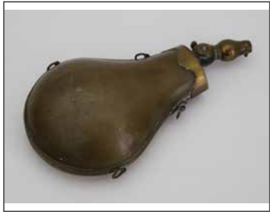
56 Deux poires à poudre de chasse. 80/100 €