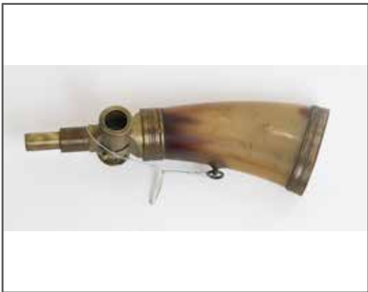
53 Poire à poudre en corne blonde, à mécanisme. État 2. 80/100 €