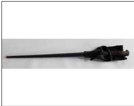
82 Baïonnette d'infanterie modèle 1874 pour fusil gras, fabrication Manufacture d'armes de Tulle, septembre 1879. Dans son fourreau en tôle d'acier bronzé avec porte-fourreau cuir noir. État 1-. 40/50 €