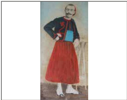
8 Photo rehaussée d'un zou- ave en pied, boléro à tom- bô blanc. 94 x 47 cm 30/40 €