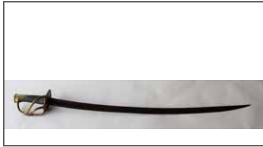
84 Sabre bancal troupe, lame à la Montmorency affinée (contre tranchant), mon- ture bronze à branches mul- tiples, calottes à courte queue. Filigrane absent, deux perçages sur le pla- teau, lame partiellement sciée au ricasso. Pas de fourreau. État 2- . 40/60 €