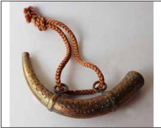
55 Poire à poudre en laiton en forme de corne à décor ciselé orientalisant. Long. : 30 cm 20/30 €