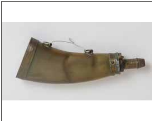
52 Poire à poudre en corne blonde, à mécanisme. État 2. 30/40 €