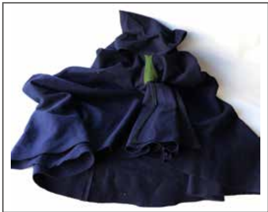
42 Burnous en drap bleu nuit, taille 3. Tombô vert, passe-poil noir. Étiquette datée 1955 (?). État 1. 50/60 €