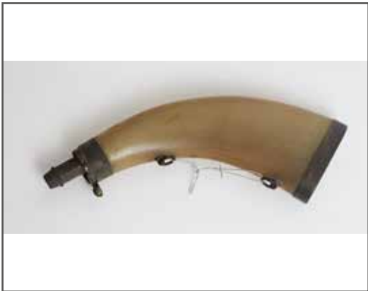
51 Poire à poudre en corne blonde, à mécanisme. État 2. 40/60 €